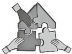
Kinder- & Jugendhaus HOCHDORF

Liebe Hochdorfer*innen, liebe Kinder & Jugendliche,