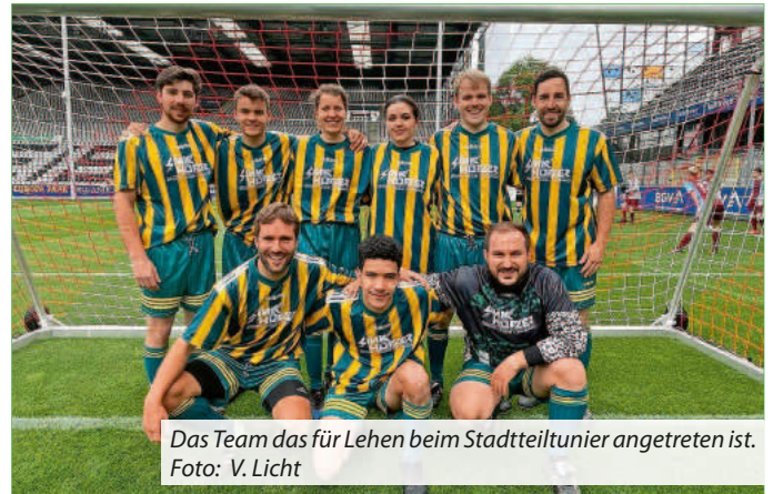
Das Team das für Lehen beim Stadtteilturnier angetreten ist.