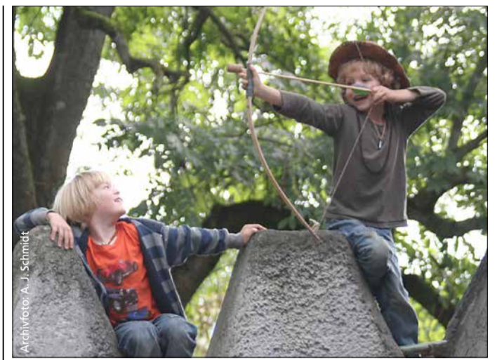
Ins Schwarze getroffen: Mit den Ferienangeboten hat Langeweile keine Chance. Auch Bogenschießen steht zur Wahl...

In der Programmliste sind sowohl kurze als auch mehrtägige Ferienangebote zu finden. Die Anmeldung erfolgt direkt bei den jeweiligen Veranstaltenden. Die Liste wird fortlaufend aktualisiert. Auch während der Sommerferien können weitere Aktionen dazukommen. Es lohnt sich also, immer wieder auf der Internetseite vorbeizuschauen. Aktuell sind mehr als 140 Angebote für die Sommerferien aktiv, sehr viele davon sind barrierefrei, etwa ein Drittel ist inklusiv nutzbar. Bei rund 90 Prozent der Plätze ist es möglich, dass auch Kinder mit Behinderung nach vorheriger Rücksprache mit den Veranstaltenden teilnehmen dürfen.