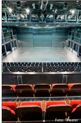
Wird bald saniert: das Kleine Haus im Theater.

Schon länger ist eine Sanierung des Kleinen Hauses und des Altbaus des Theaters Freiburg vorgesehen, jetzt kann es losgehen: Nach dem erfolgreich abgeschlossenen europaweiten Vergabeverfahren nimmt ein mehrteiliges Planungsteam nun die Arbeit auf.