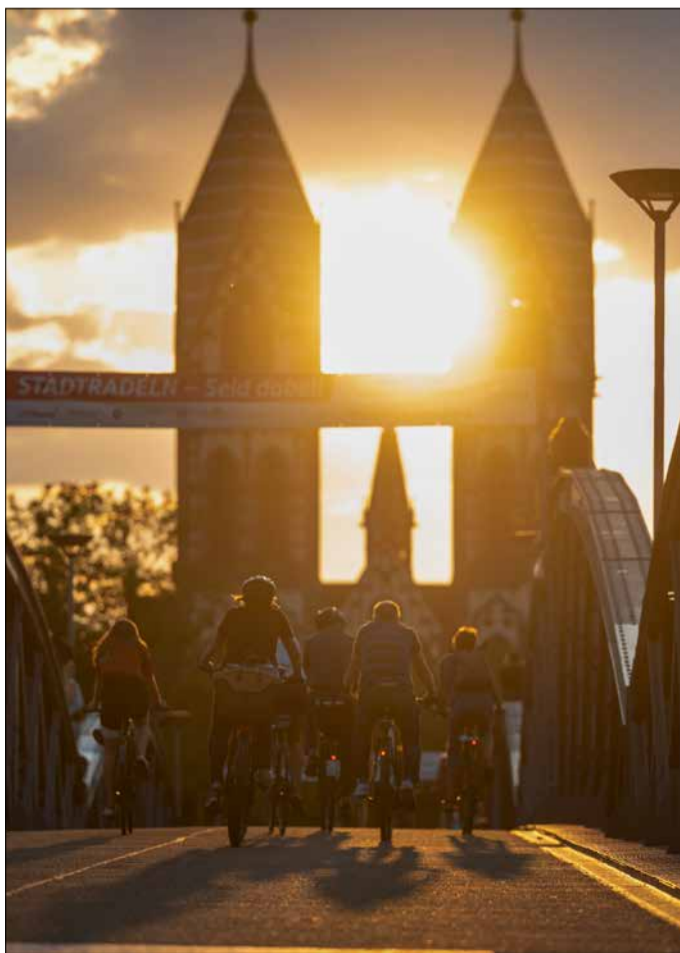
Rekorde über Rekorde: So viele Menschen wie noch nie radelten für Freiburg so viele Kilometer wie noch nie.

📄 www.stadtradeln.de/freiburg , www.freiburg.de/stadtradeln