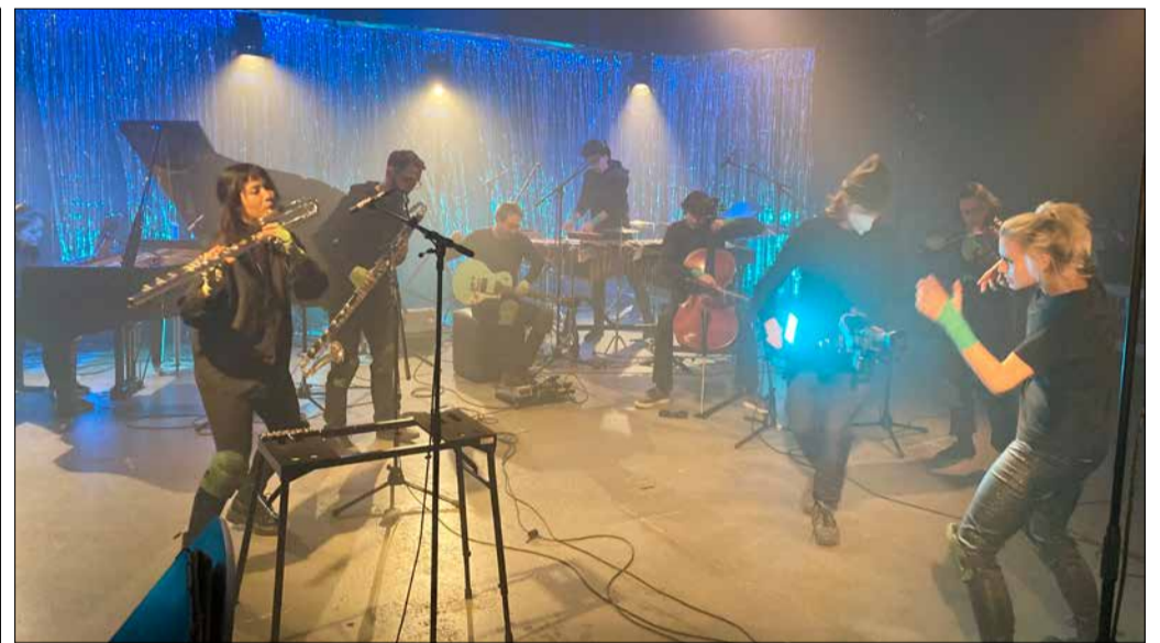
Vielfältige künstlerische Mittel verwendet das ensemble scope.

Das Förderprogramm richtet sich an Kreative aus den genannten Bereichen und ist inhaltlich bewusst weit gefasst. Nicht gefördert werden Streamings konventioneller Kon-