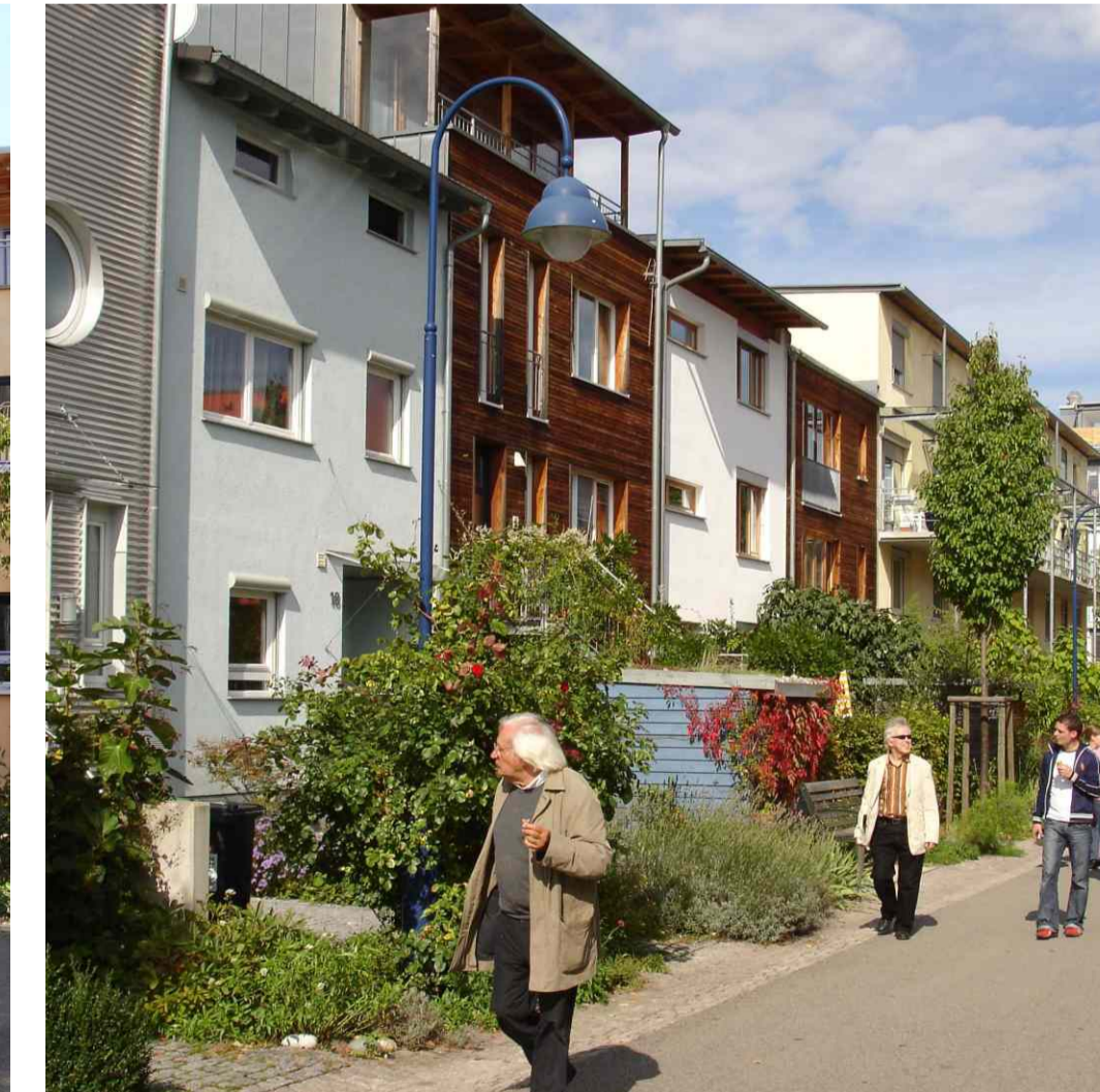
Reihenhäuser - Terraced houses