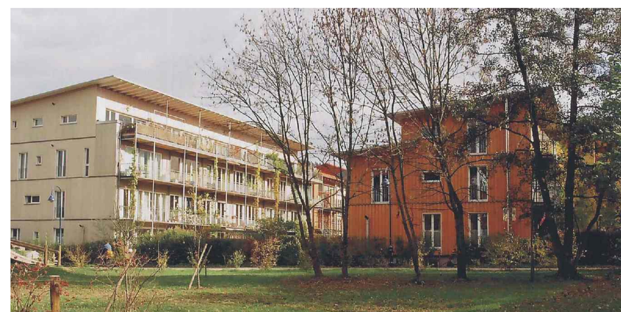
Mehr- u. Einfamilienhäuser Baugruppe - Multiple-family houses and terraced houses with several-building owners

To allow for individual designs and to prevent the development of a monostructural residential area, building plots were predominantly distributed to private building-owners (approx. 70%). The houses built by private owners can be divided into single building projects (on parcels with a width between 6 m and 9 m) and building projects of groups of building-owners who cooperated in the development of the building from the start. Normally these are four-storey multiple-family houses, which consist of two accommodation units built on top of each other with each unit taking up two storeys (maisonette). The upper unit is reached via an access balcony. The objects of property developers with partly different ways of access (e.g. stairwells with access to several different accommodation units via each landing) can be divided into apartment buildings, condominiums, and buildings with a mix of both condos and rented apartments. The latter case applies to some of the cooperative building projects. So far, plots in the sectors dedicated to five-storey buildings with a building height of up to 15 m have only been allotted to larger groups of building-owners and property developers without exception (as is currently the case in sector 3).