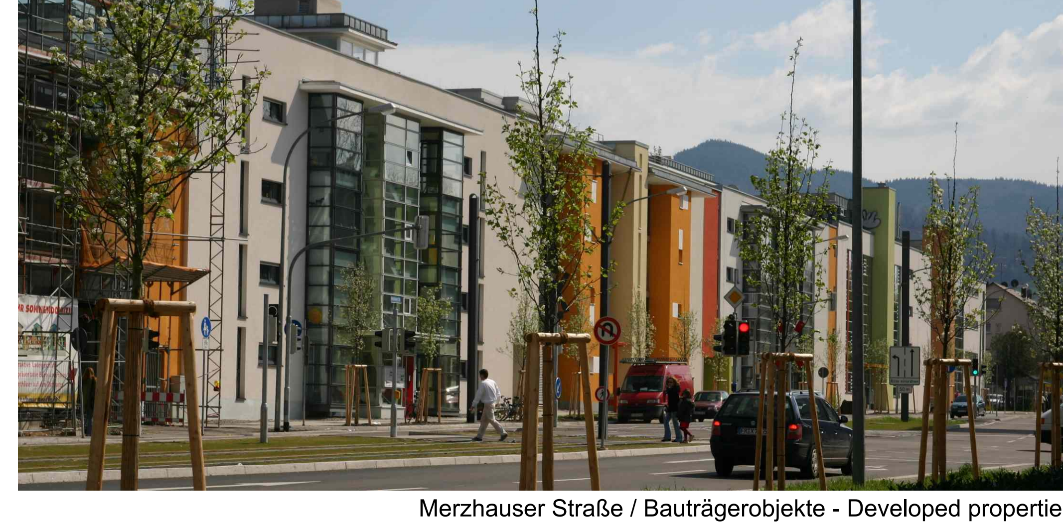
Merzhauser Straße / Bauträgerobjekte - Developed properties