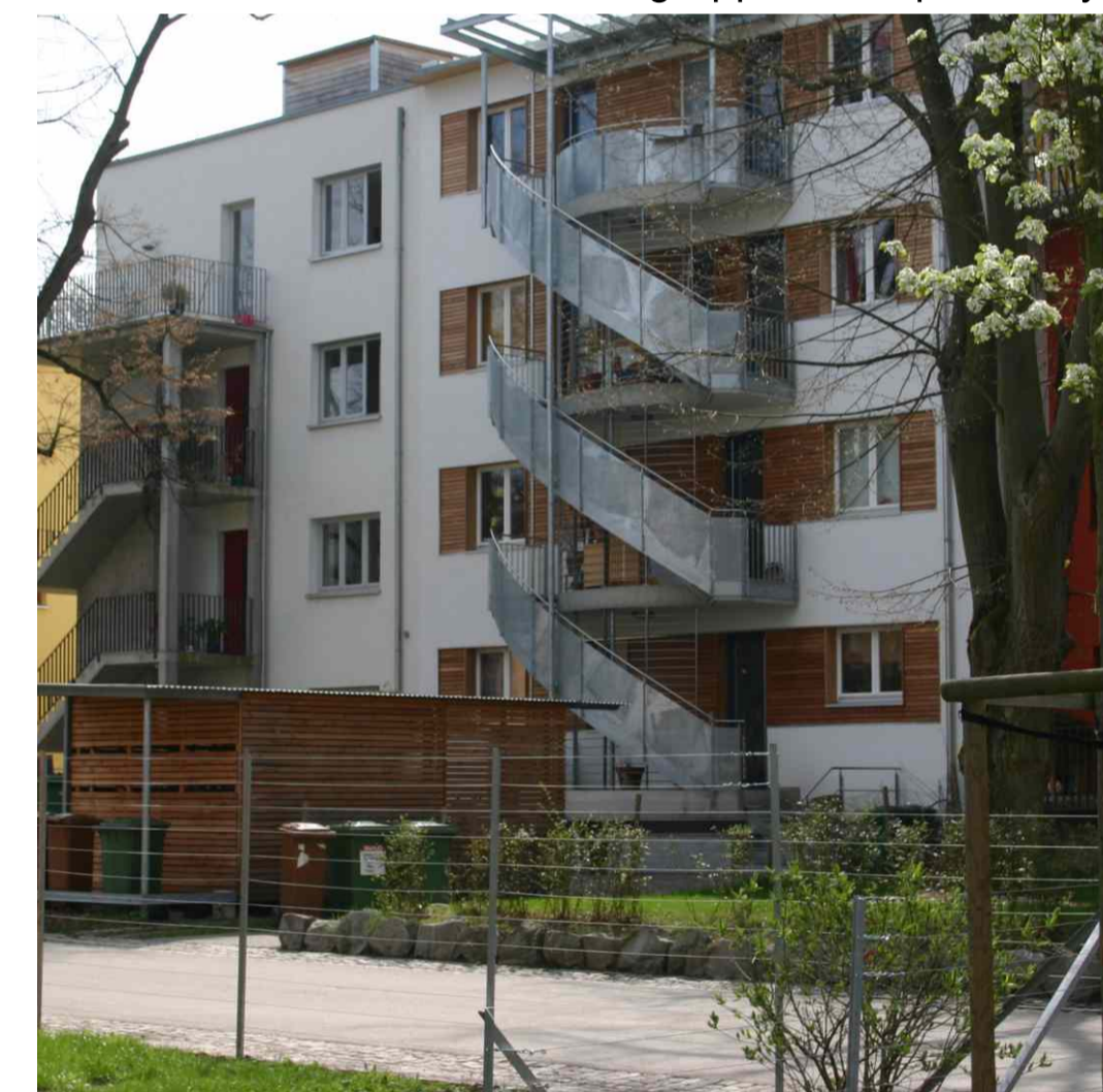
Mehrfamilienhaus Baugruppe-Multiple-family house, several building-owners