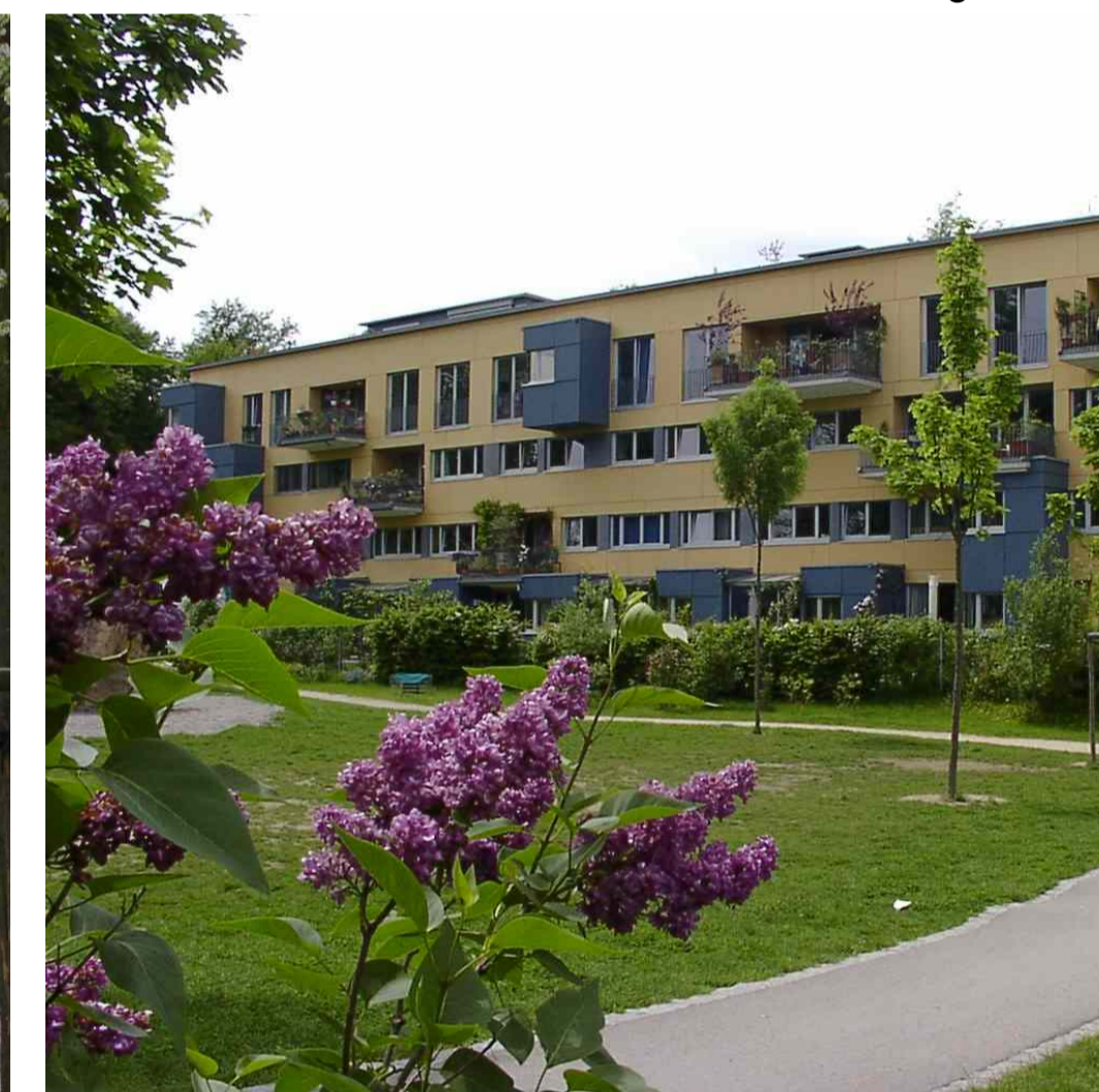
Mehrfamilienhaus Baugruppe-Multiple-family house, several building-owners