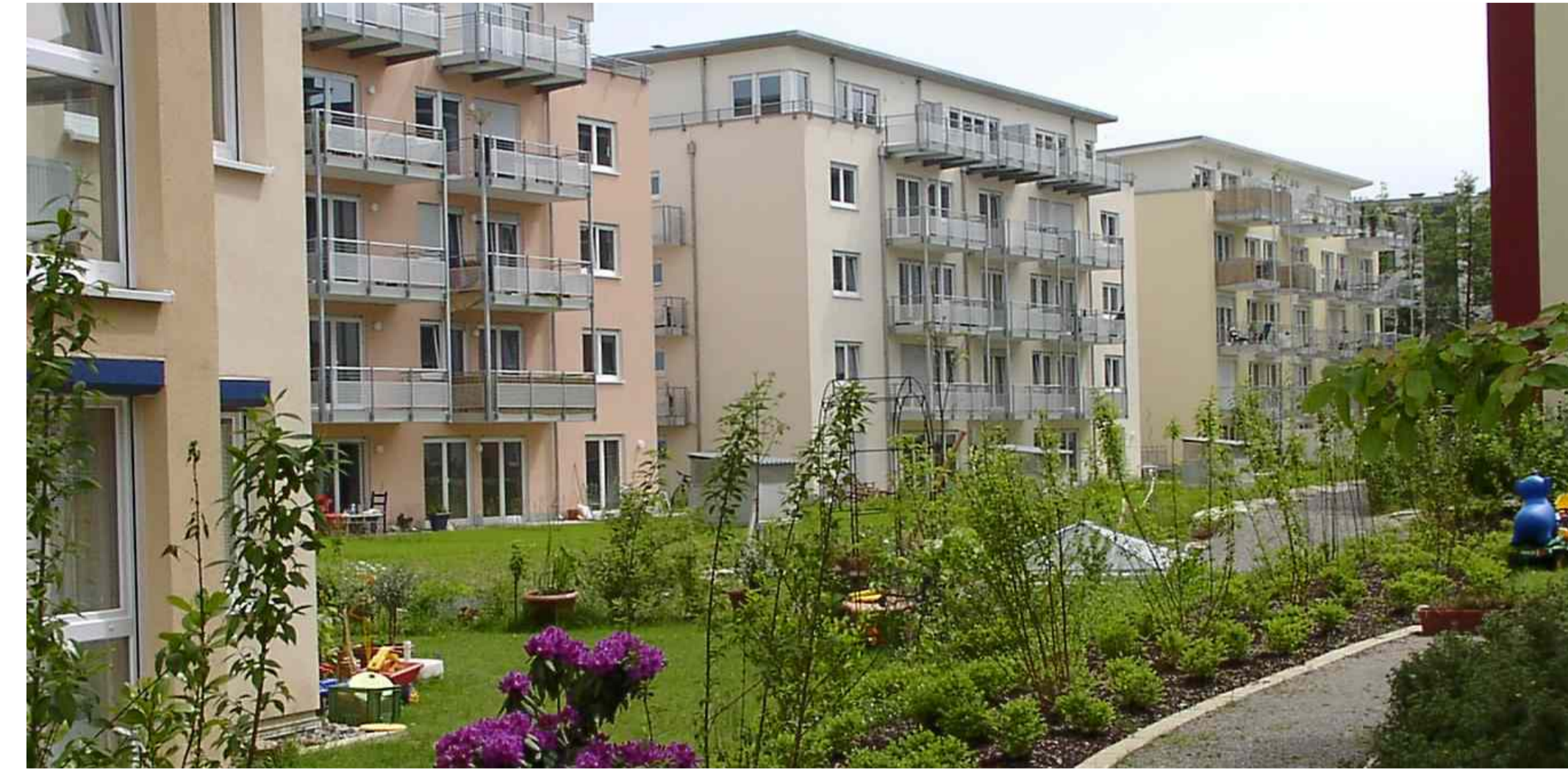
Louise-Otto-Peters-Straße / Bauträgerobjekte - Developed properties