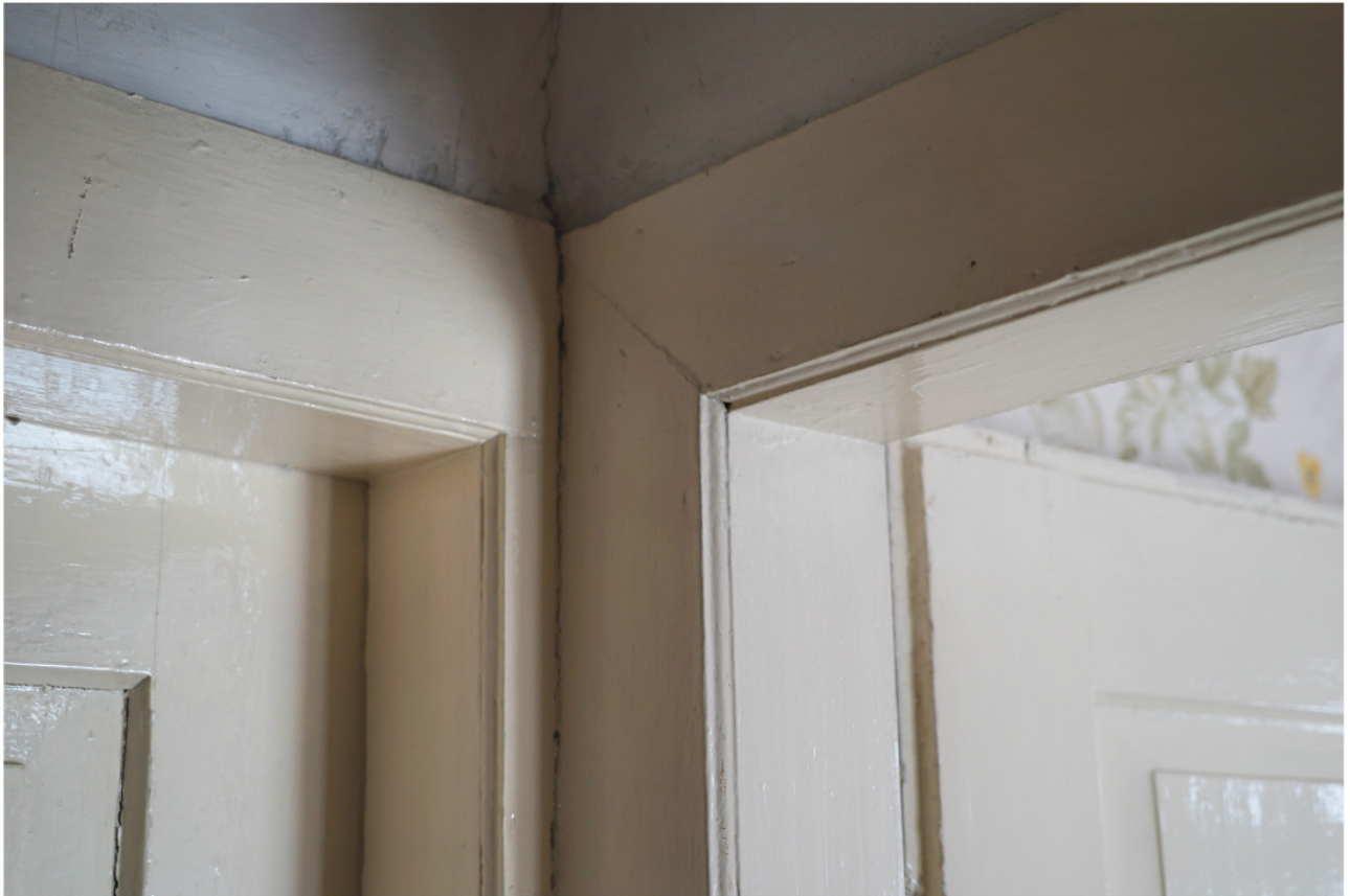
Obergeschoss, profilierte Rahmen zu den Türen der beiden Zimmer