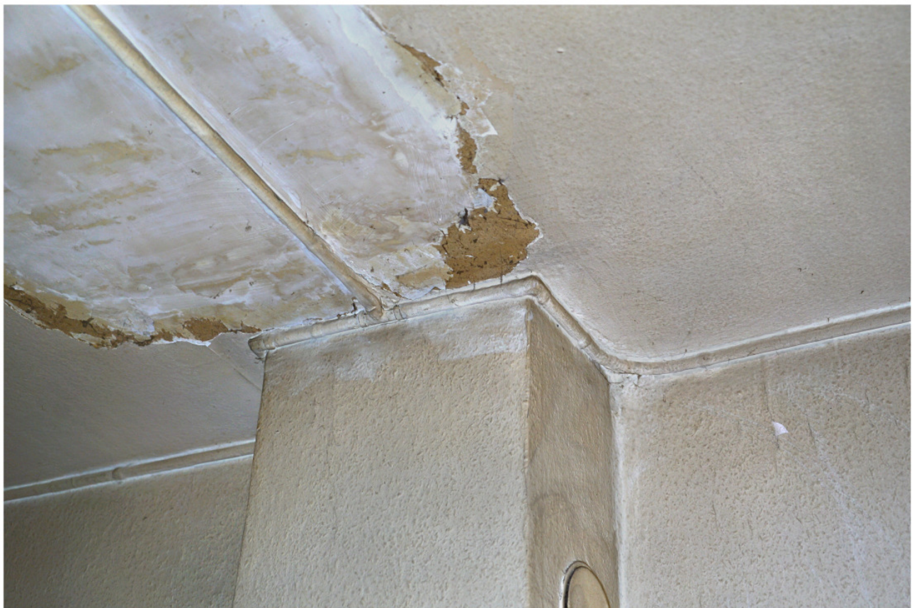
Kaminbereich im erdgeschossigen Wohnzimmer mit Elektroleitungen in Bleiröhren auf Putz verlegt