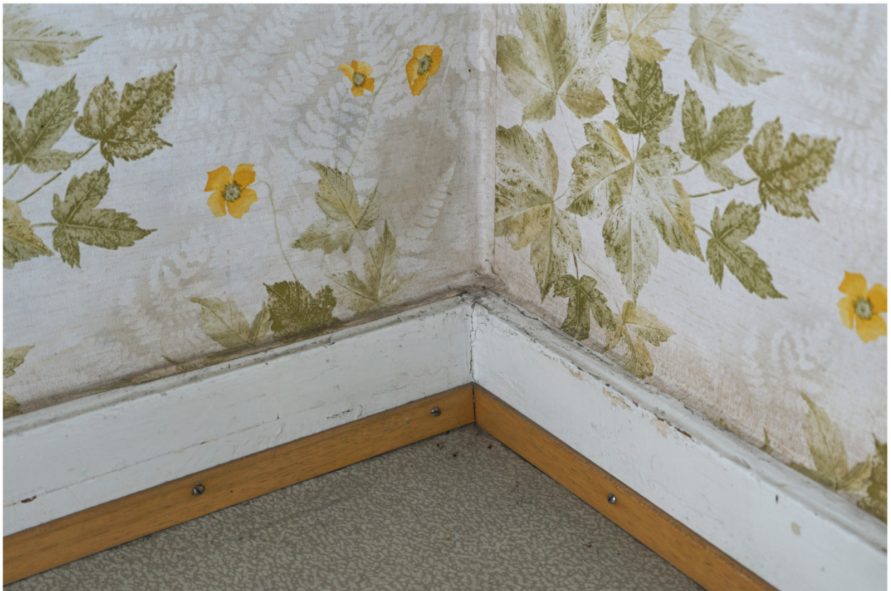
Obergeschoss, Sockelbrett im Zimmer neben der Treppe mit Oberkante in Form eines Kanies; später zusätzliche Leiste aufgesetzt