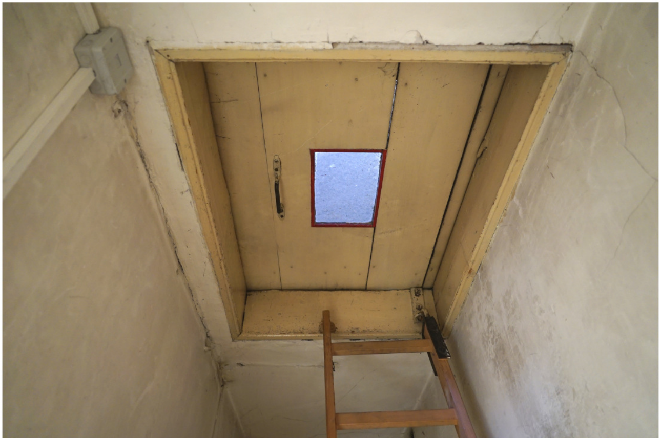
Falltür zum Dachraum mit eingesetzter Verglasung, zugänglich über eine seitlich wegklappbare hölzerne Leiter