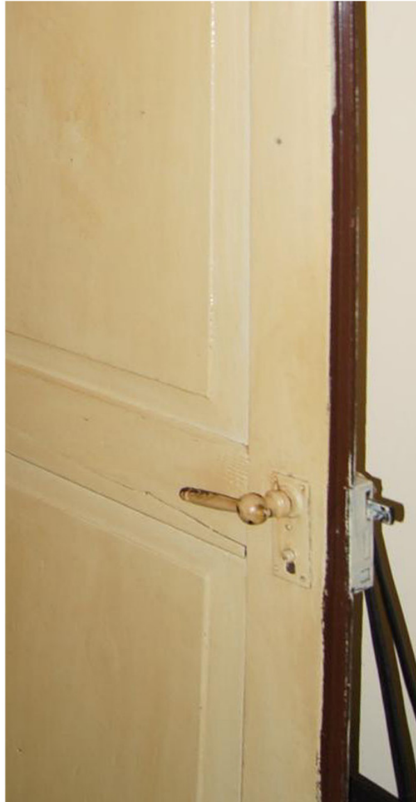
Nr. 74p: Türgriff im Obergeschoss vermutlich aus der Bauzeit 40