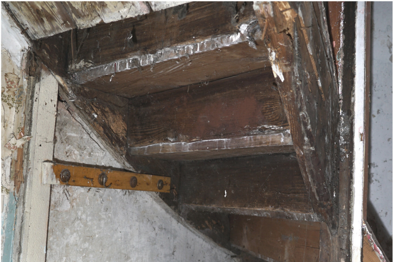
Wie Abb. 15, Untersicht mit stumpf zwischen die Trittbretter eingesetzt und vernagelten Stellbrettern