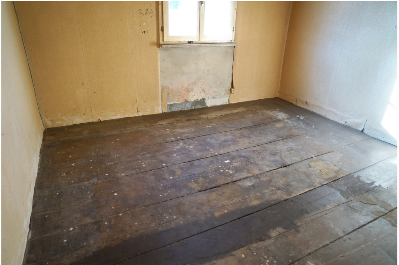
Bauzeitliche Dielung im Obergeschoss, die früheren Sockelleisten zeichnen sich als Fehlstellen ab