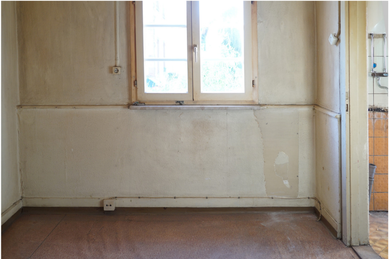
Brüstungstäfer an der Außenwand im Wohnraum des Erdgeschosses