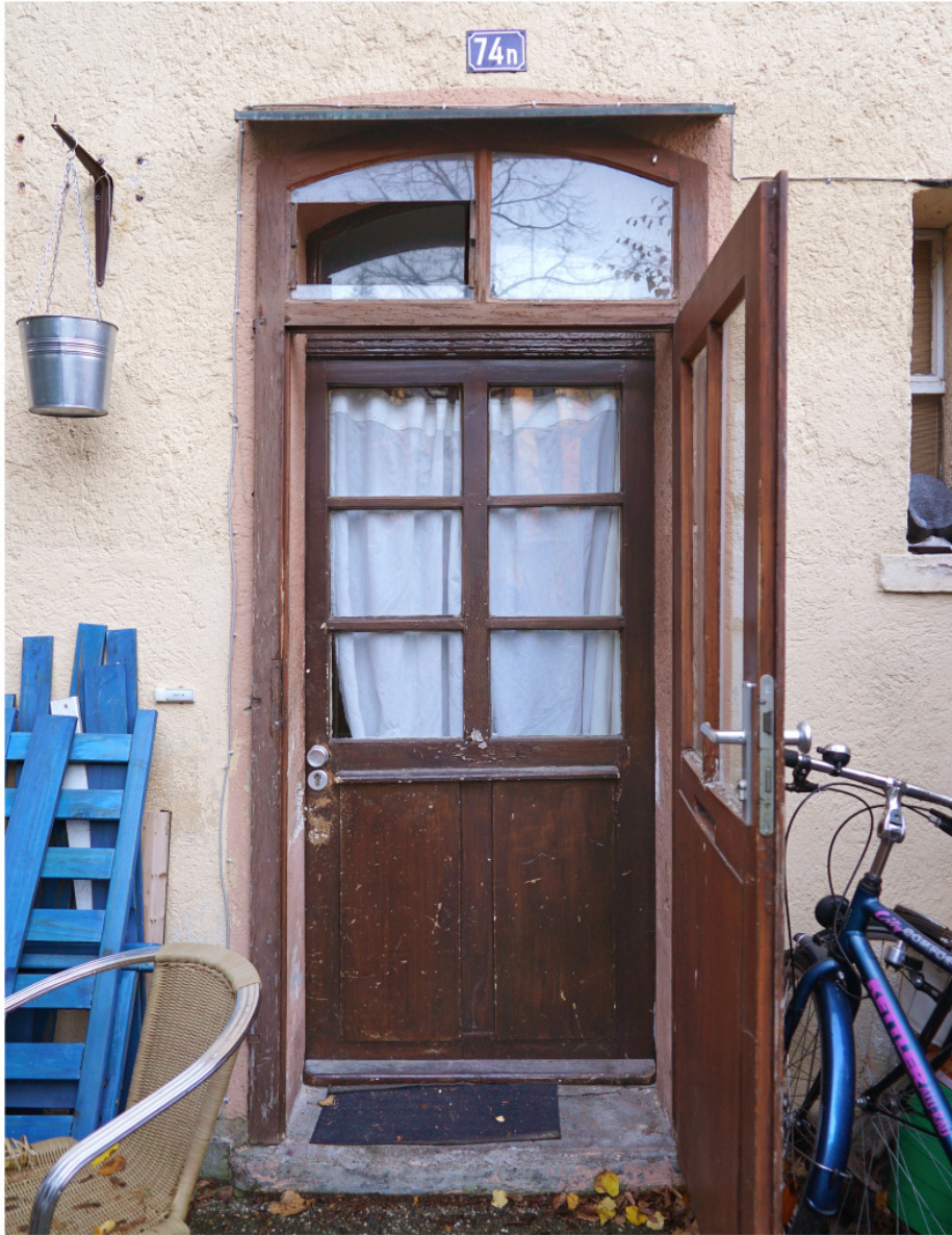
Bauzeitliche Hauseingangstür mit Oberlicht und jüngerer Vortür 1