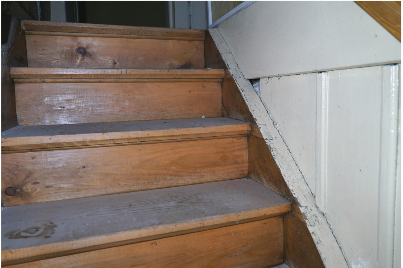
Treppe ins Obergeschoss mit seitlichen Flickstellen vom Austausch der Stufen herrührend