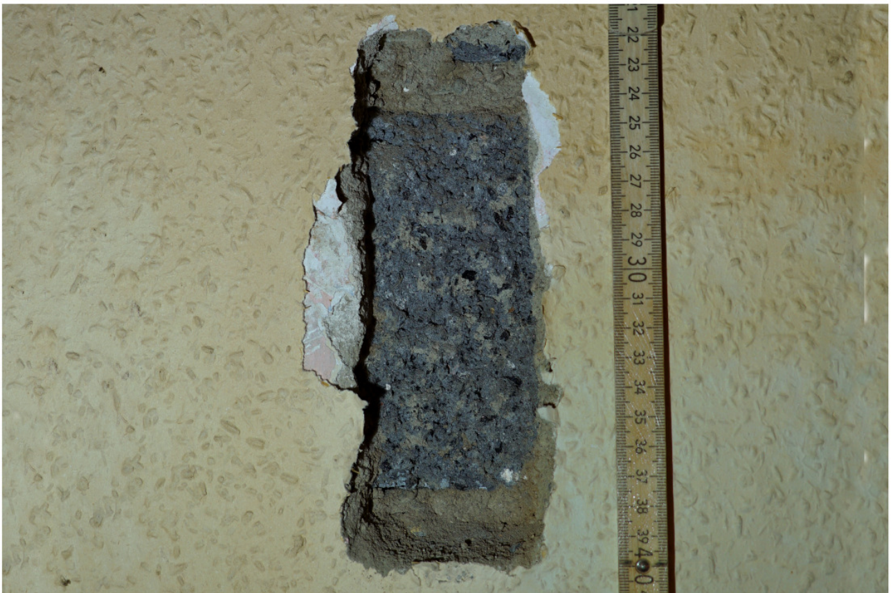
Obergeschoss, Sondage an einer Innenwand, die mit Schlackensteinen gemauert wurde