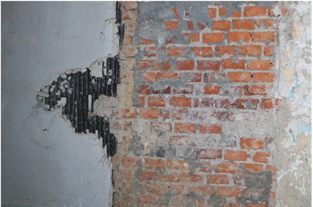
Trennwand in Firstlinie: abgeschroteter Bereich mit erkennbarem Backsteinbinderverband, links späterer Unterbau für Neuverputzung aus Teerpappe und Drahtgeflecht 12