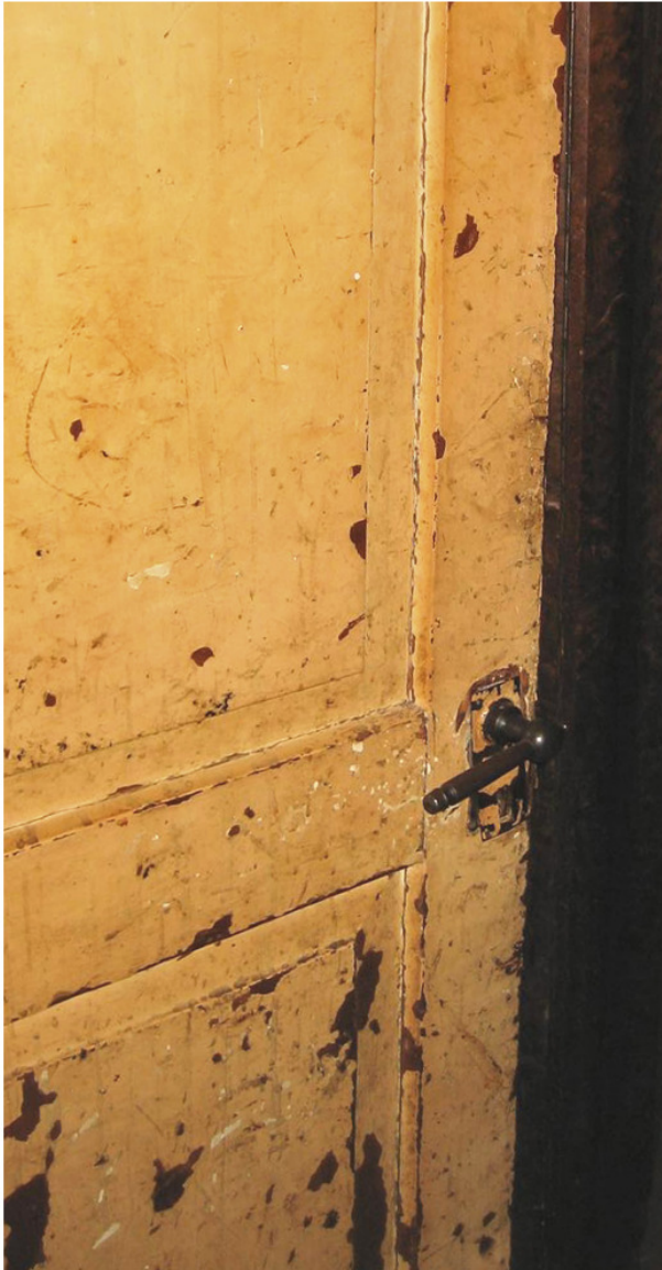
Nr. 74d: Türgriff im Obergeschoss vermutlich aus der Bauzeit 39