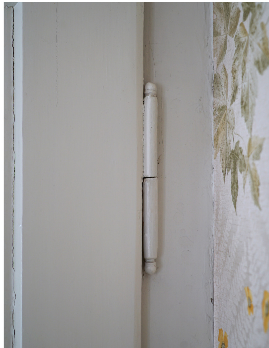
Wie Abb. 27, Fitschelband