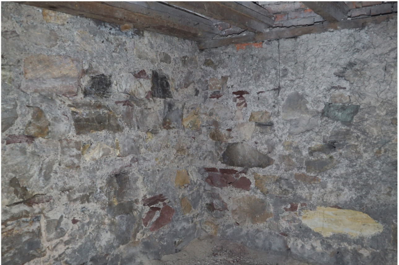
Wie Abb. 33, Mauerstruktur aus unterschiedlichen Gesteinen und wechselnden Größen