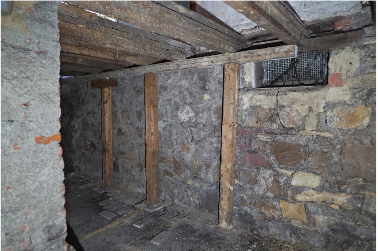
Traufwand des Kellers mit modern ersetzttem Fenster und nachträglicher Stützkonstruktion