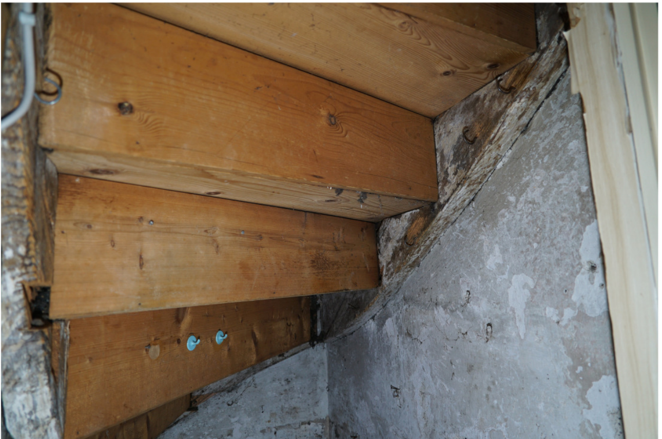
Wie Abb. 17, Untersicht, wo der Austausch der Tritt- und Stellbretter sichtbar wird