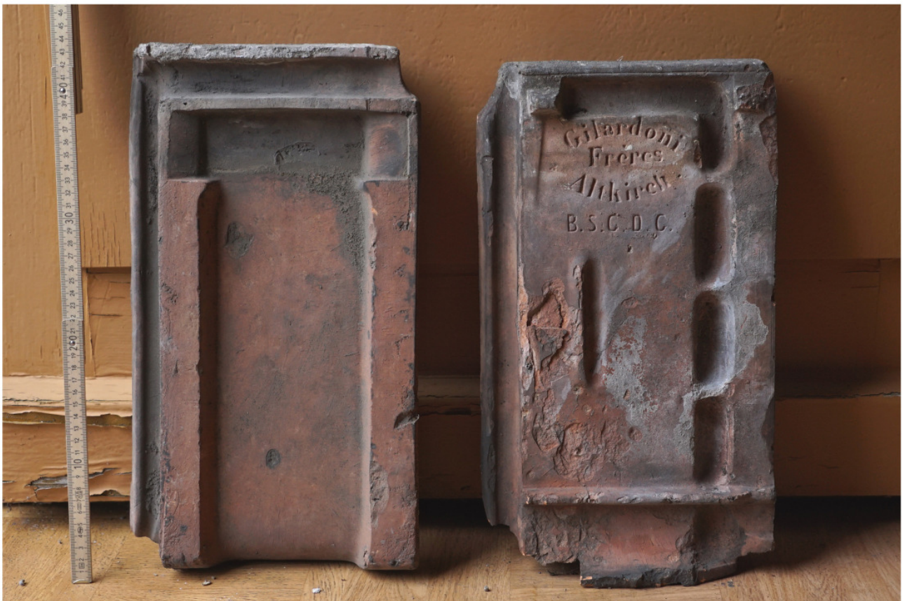
Falzziegel, Außen- und Innenseite, 43/23,5 cm, Stempel: Gilardoni Frères Altkirch / B.S.C.D.C.