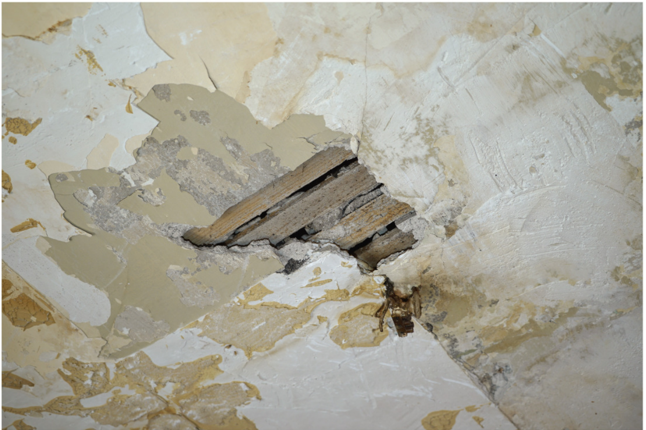
Putzdecke des Erdgeschosses mit engliegenden Trägerleisten