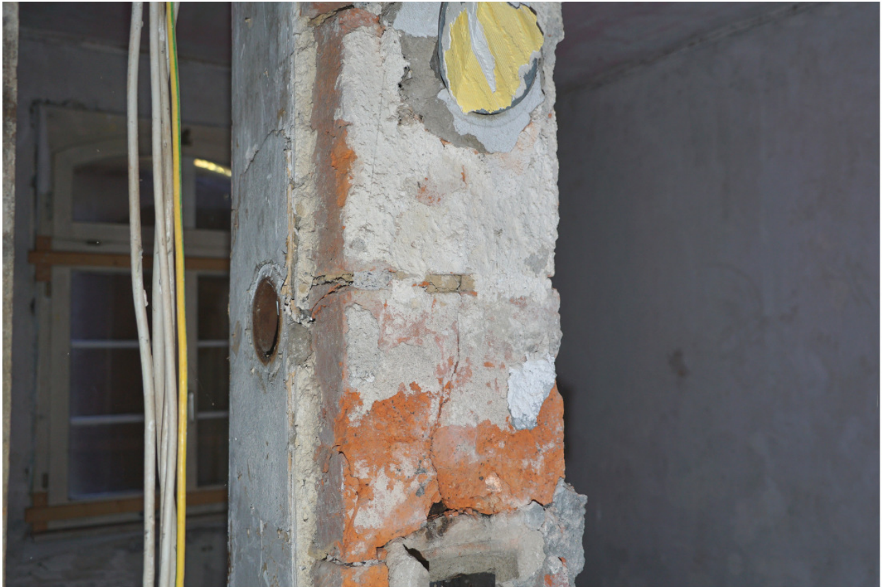
Erdgeschoss, freigestellter Kamin aus Ziegelformsteinen in Würfelform von 31 cm Kantenlänge 11