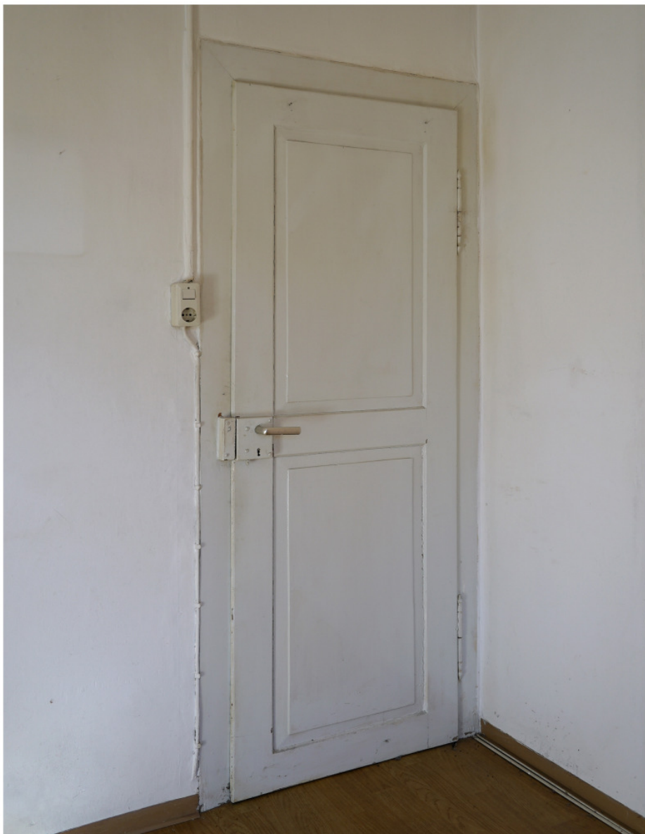
Tür im Obergeschoss