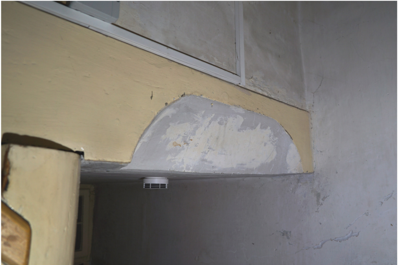
Konkav ausgespartes Deckbrett an der Treppe