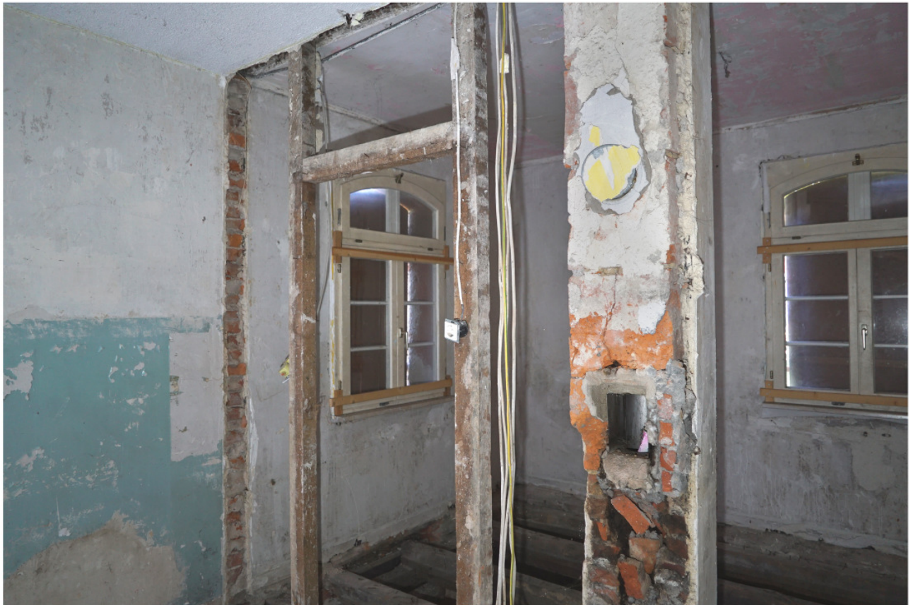
Erdgeschoss mit ausgebrochenen Wandfüllungen, sodass nur Rahmenschnkel und freigestellter Kamin verblieben sind