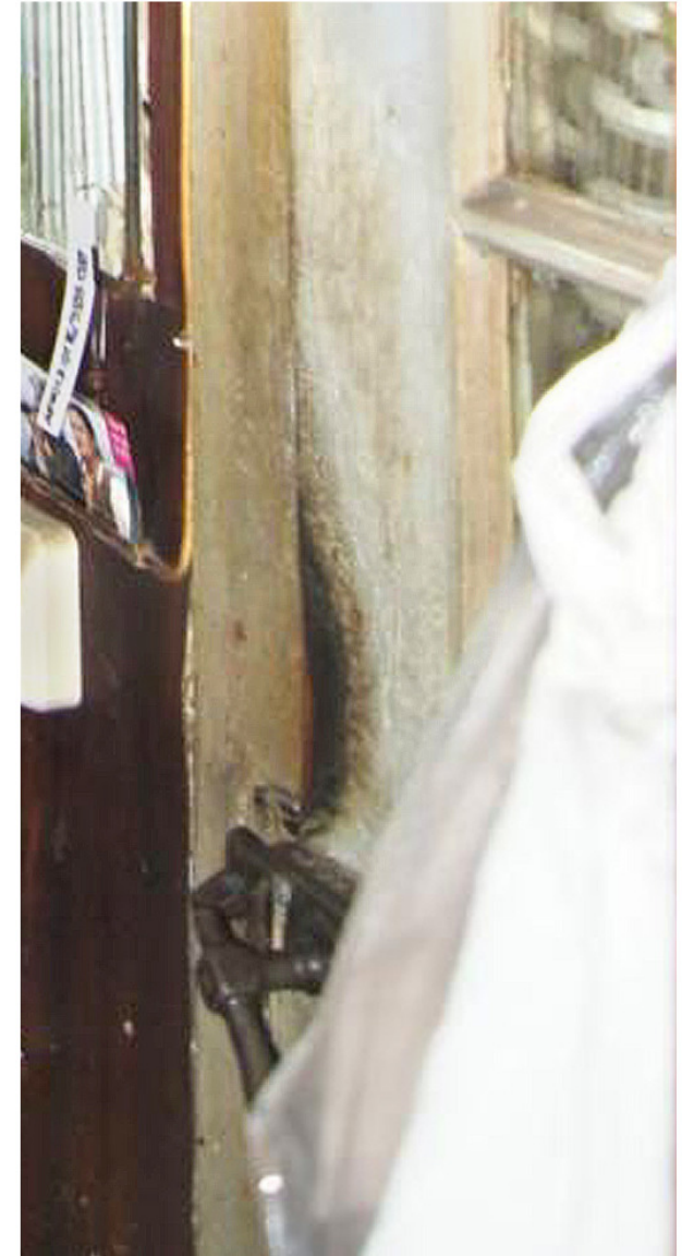
Nr. 74r: Türgriff im Erdgeschoss an der Tür zur Geschosstreppe 41