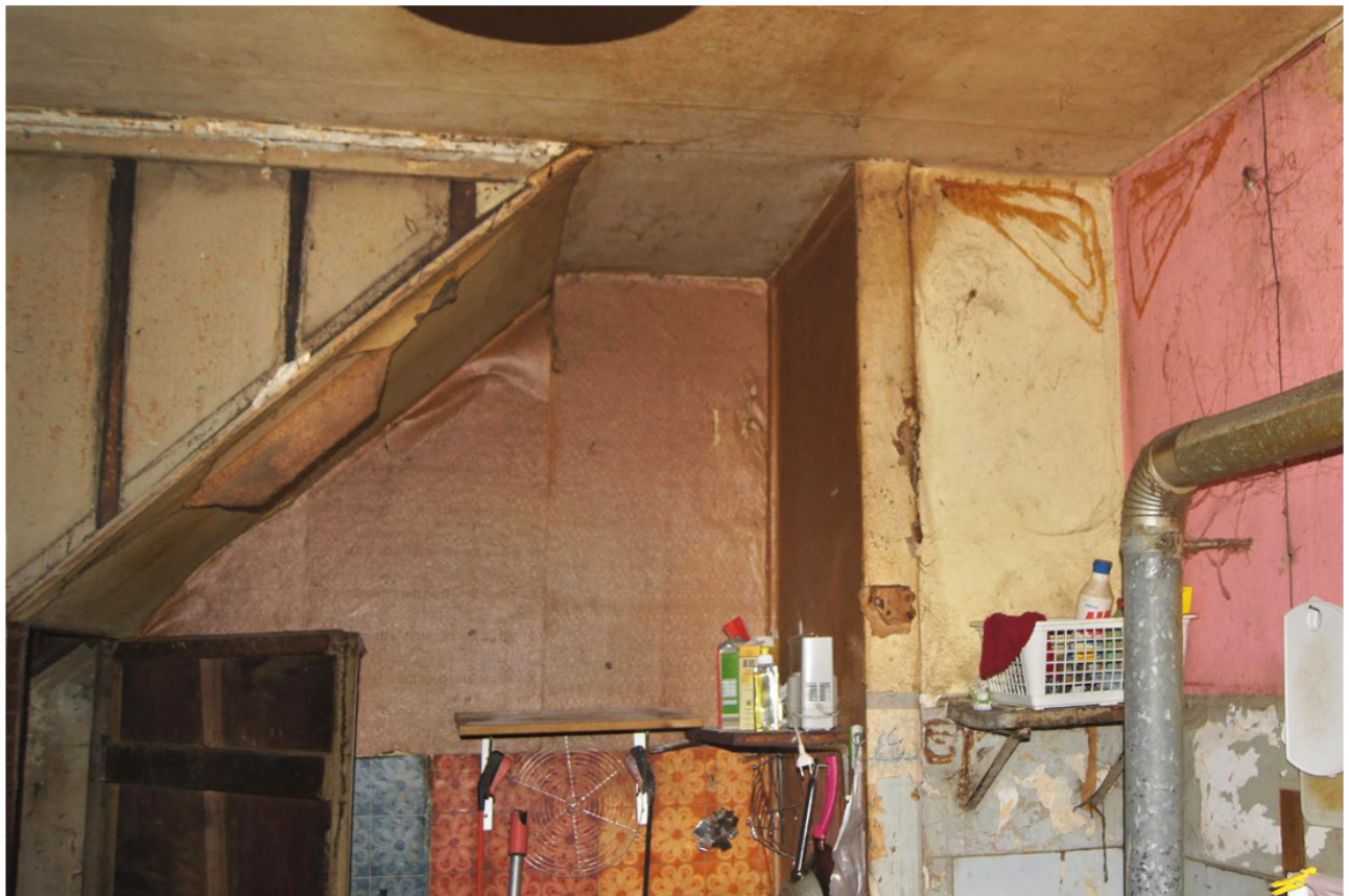
Haus Nr. 74r: Rückwand der Küche mit geschlossenem Kasten, der als Wandschränk für das Wohnzimmer dient