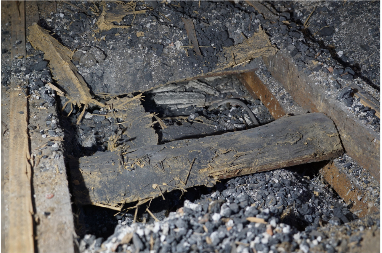
Aufschluss im Boden des Obergeschosses: Blindboden aus Schwarten auf angenagelten Seitenleisten und Schlackenfüllung