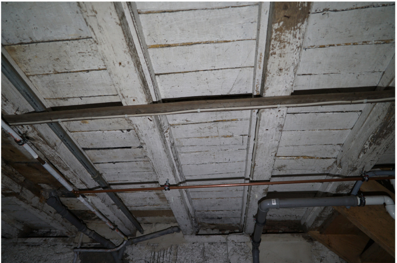
Untersicht der Kellerdecke mit Blindboden auf angenagelten Seitenleisten