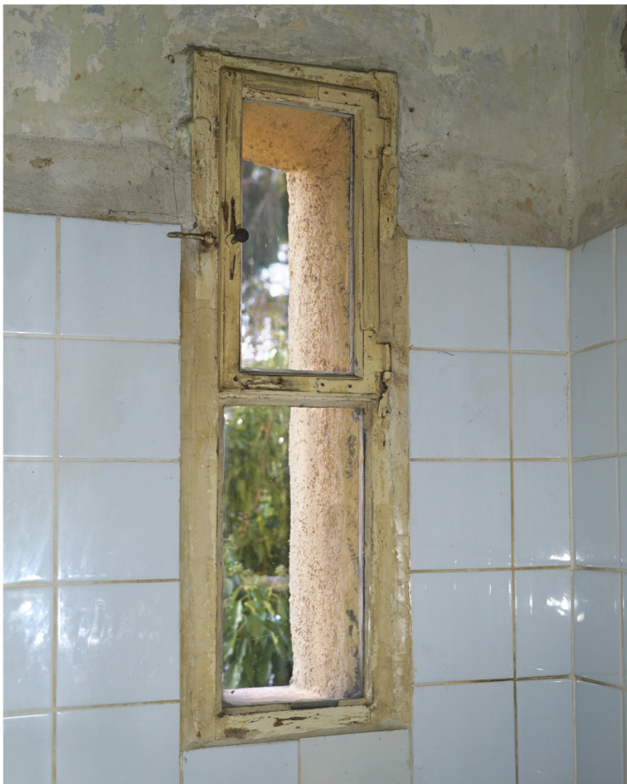
Abortfensterchen von Nr. 72b, Innenseite mit aufliegendem, 3 in den Falz greifenden Flügel