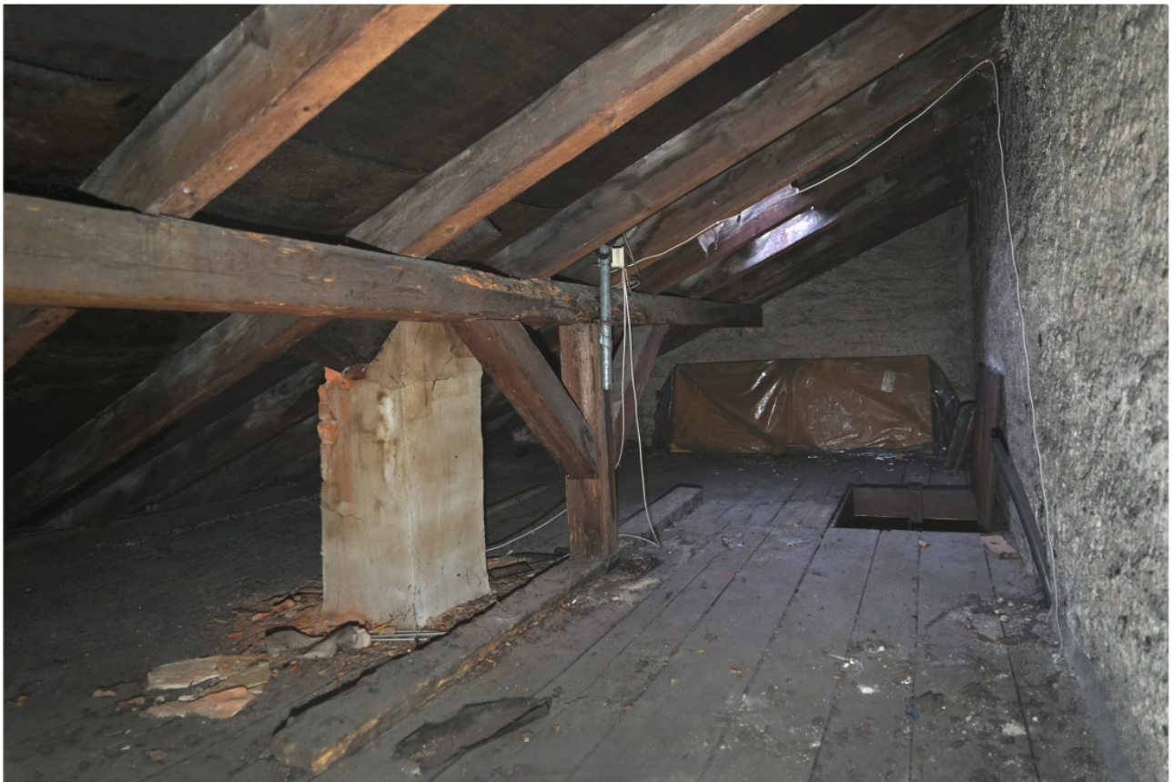
Dachwerk mit mittiger stehender Stuhlachse, Kamin und Falltür