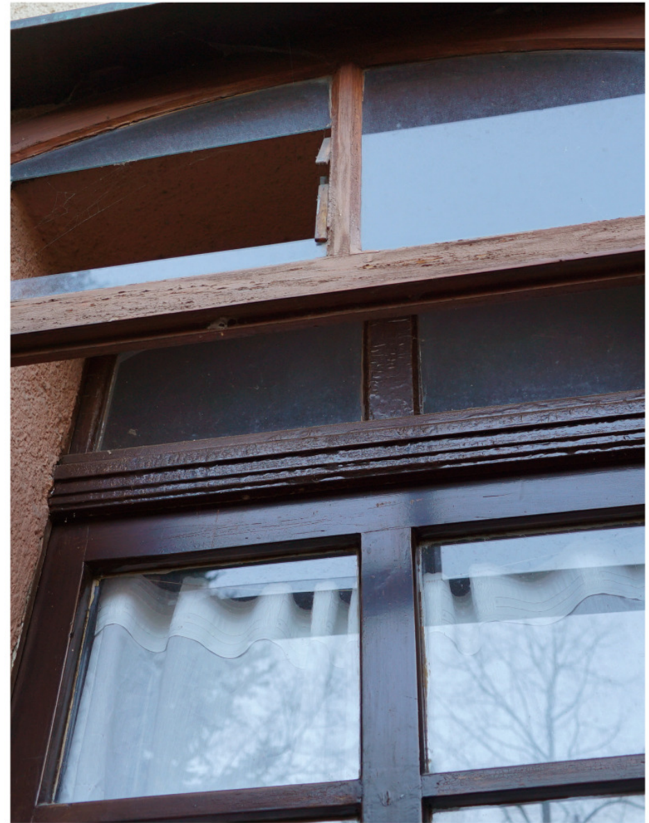
Wie Abb. 1, gestuft profiliertes Sturzholz zum Oberlicht 2

Freiburg, Knopfhäusle, Schwarzwaldstraße 70-76 / 74n