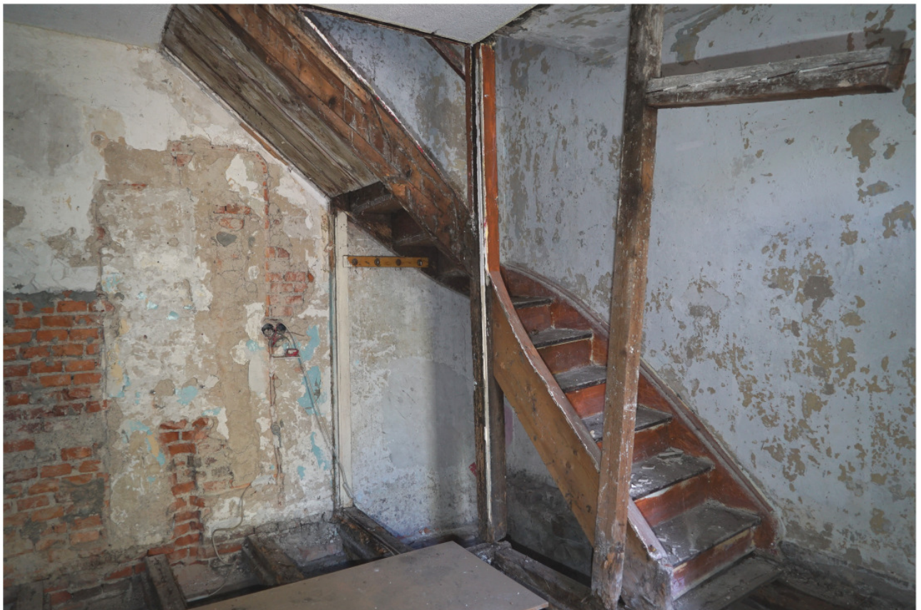
Treppe ins Obergeschoss, bei der die Brettereinhausung entfernt wurde