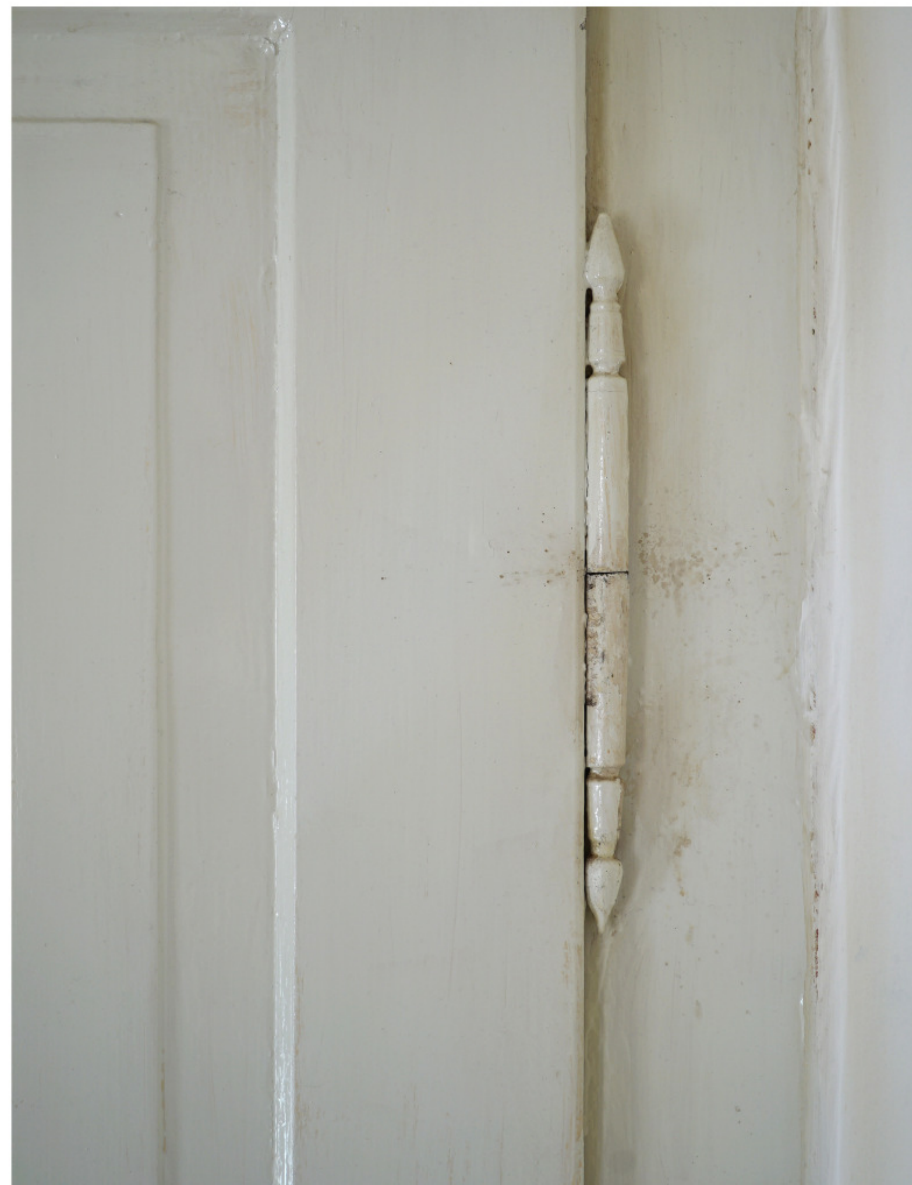
Wie Abb. 29, Fitschelband