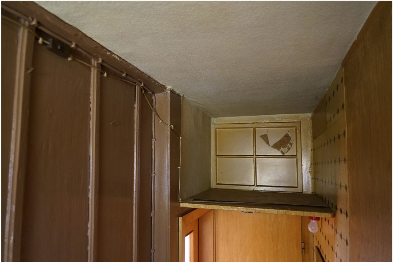
Treppe ins Obergeschoss, Blick zurück zum Oberlicht über der Aborttür