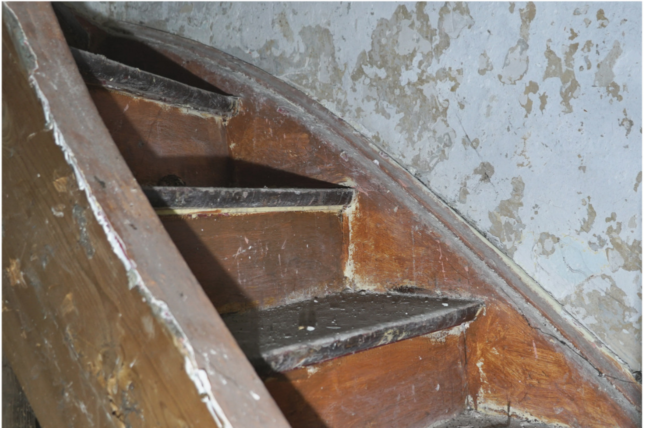
Treppe ins Obergeschoss, Stufen mit Viertelkreisrundung hinterschnitten