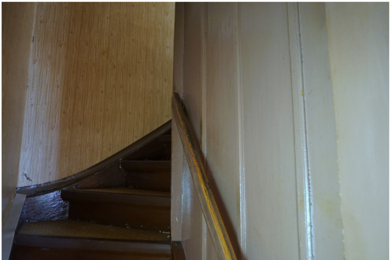
Wie Abb. 19, Blick nach oben