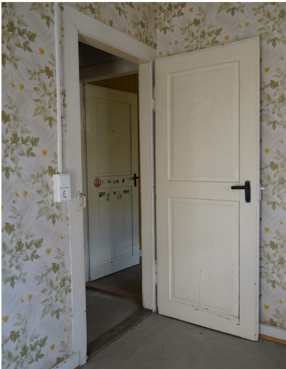
Kassettentüren im Obergeschoss