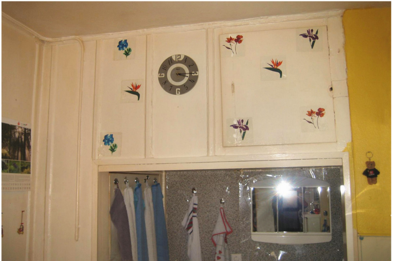
Haus Nr. 72f: Einbauschränk in der Küche mit Schranktür rechts oberhalb der Nische