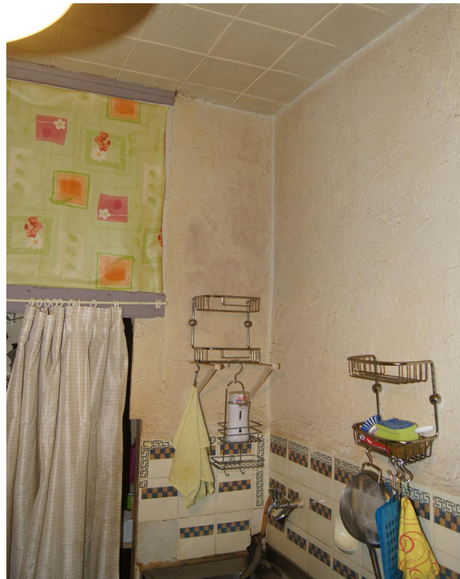
Haus Nr. 74p: Einbauschränk an der Rückwand der Küche mit integriertem Kellerabgang innerhalb der Nische, rechts Anschluss an vermuteten früheren Wandschränk für das Wohnzimmer, heute zur Nische hin offen