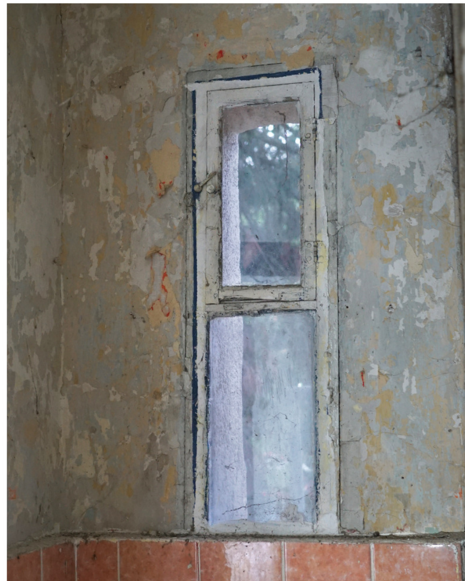
Abortfensterchen von Nr. 74l, Innenseite mit bündig in den 4 Rahmen einschwenkendem Flügel