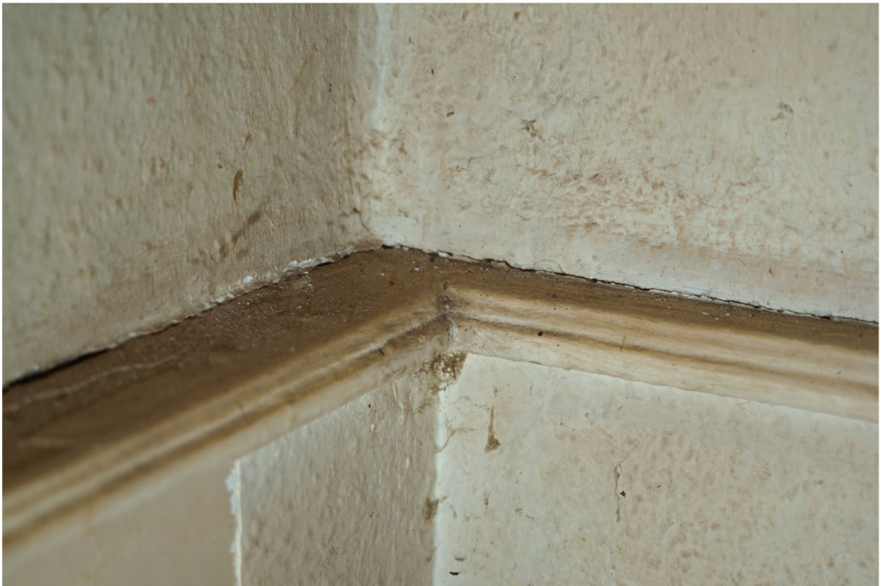
Wie Abb. 9, profiliertes Deckbrett