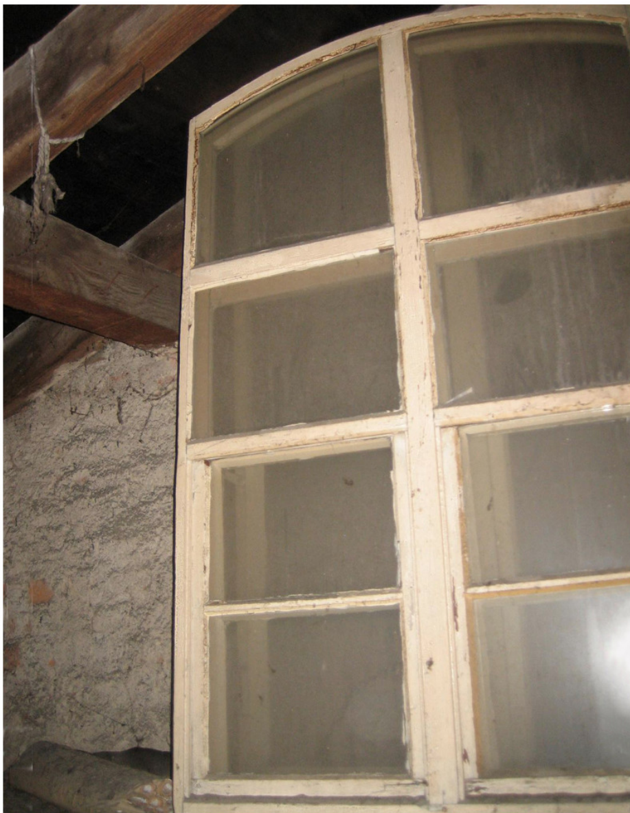
Haus Nr. 72f: Frühere Vorfenster im Dachraum abgestellt 42

Freiburg, Knopfhäusle, Schwarzwaldstraße 70-76