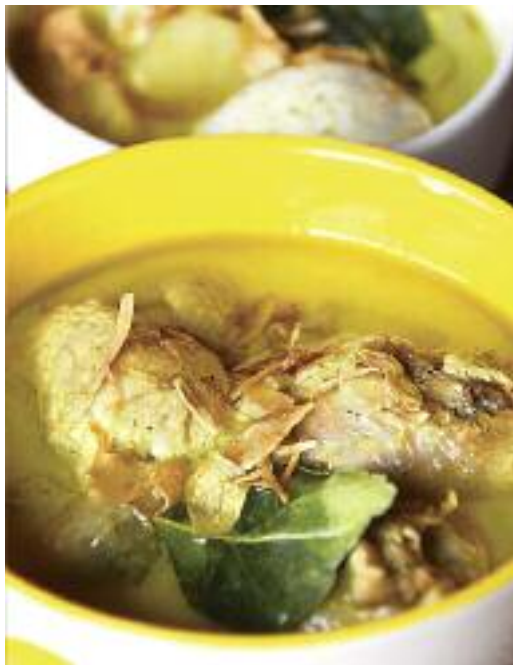
Mhmm, lecker: Das Opor Ayam ist fertig!

Indonesien wäre ohne seine einzigartige Küche undenkbar. Gewürze wie Ingwer, Zitronengras und Kokosmilch verleihen indonesischem Essen seinen charakteristischen Geschmack. Eines meiner Lieblingsgerichte, das auch gerne von meinen Kindern gegessen wird, ist das „Opor Ayam“.