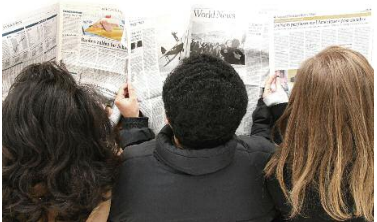
Was da wohl drin steht? Nun, blättern Sie einfach um und lesen Sie.