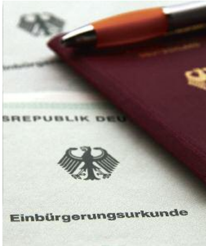
Das obscure Objekt der Begierde

landesweit 29 000 Menschen Deutsche, im vergangenen Jahr 2008 waren es nur noch 11 300. Für Freiburg passt dieser Trend zumindest für die vergangenen Jahre nicht: Seit 2005 lag die Zahl der Eingebürgerten