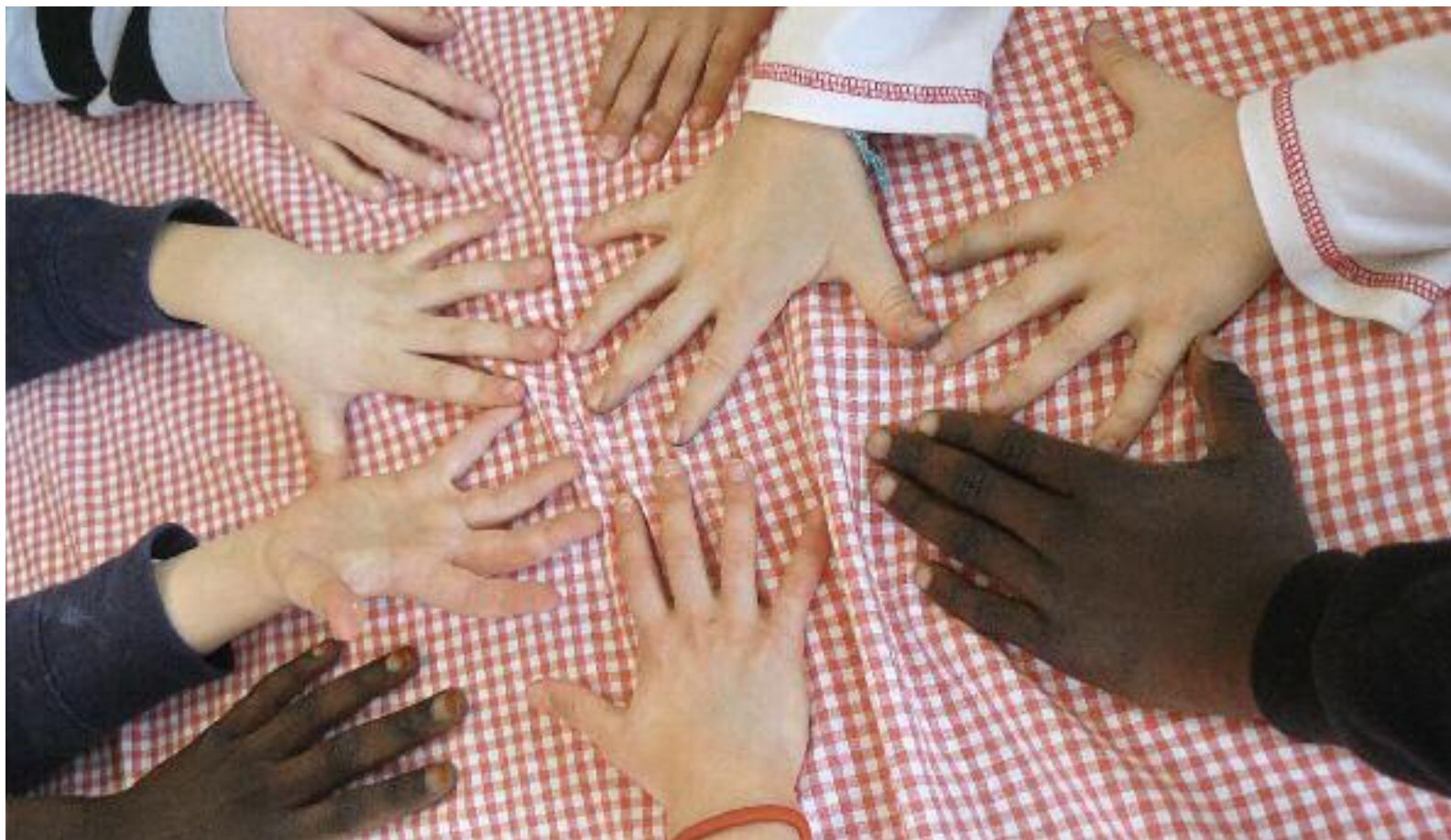
Eins, zwei, drei... – wie viele Sprachen sprechen diese Kinder?