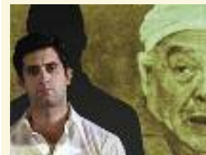
garajistanbul mit „Reporter“ – am 12./13. Februar im Theater Freiburg.

→ TÜRKEI-WOCHENENDE: Unter dem Motto „Freiburg – Istanbul. Eine Theaterpartnerschaft“ gastiert am 12. und 13. Februar jeweils um 20 Uhr garajistanbul mit dem Stück „Reporter“ im Theater Freiburg (Kleines Haus); dazu gibt's