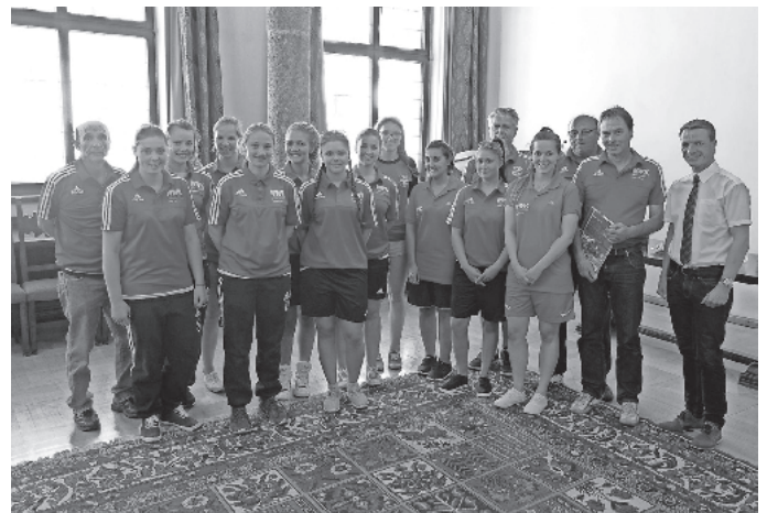
Fussballfrauen in Innsbruck