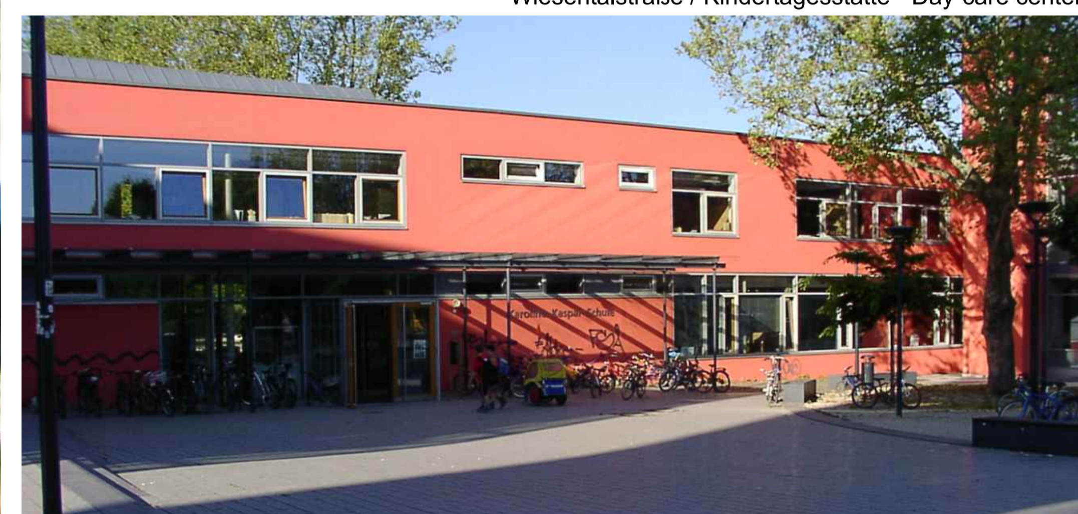
Karoline-Kaspar-Grundschule Vorderfront - The front of Karoline Kaspar elementary school