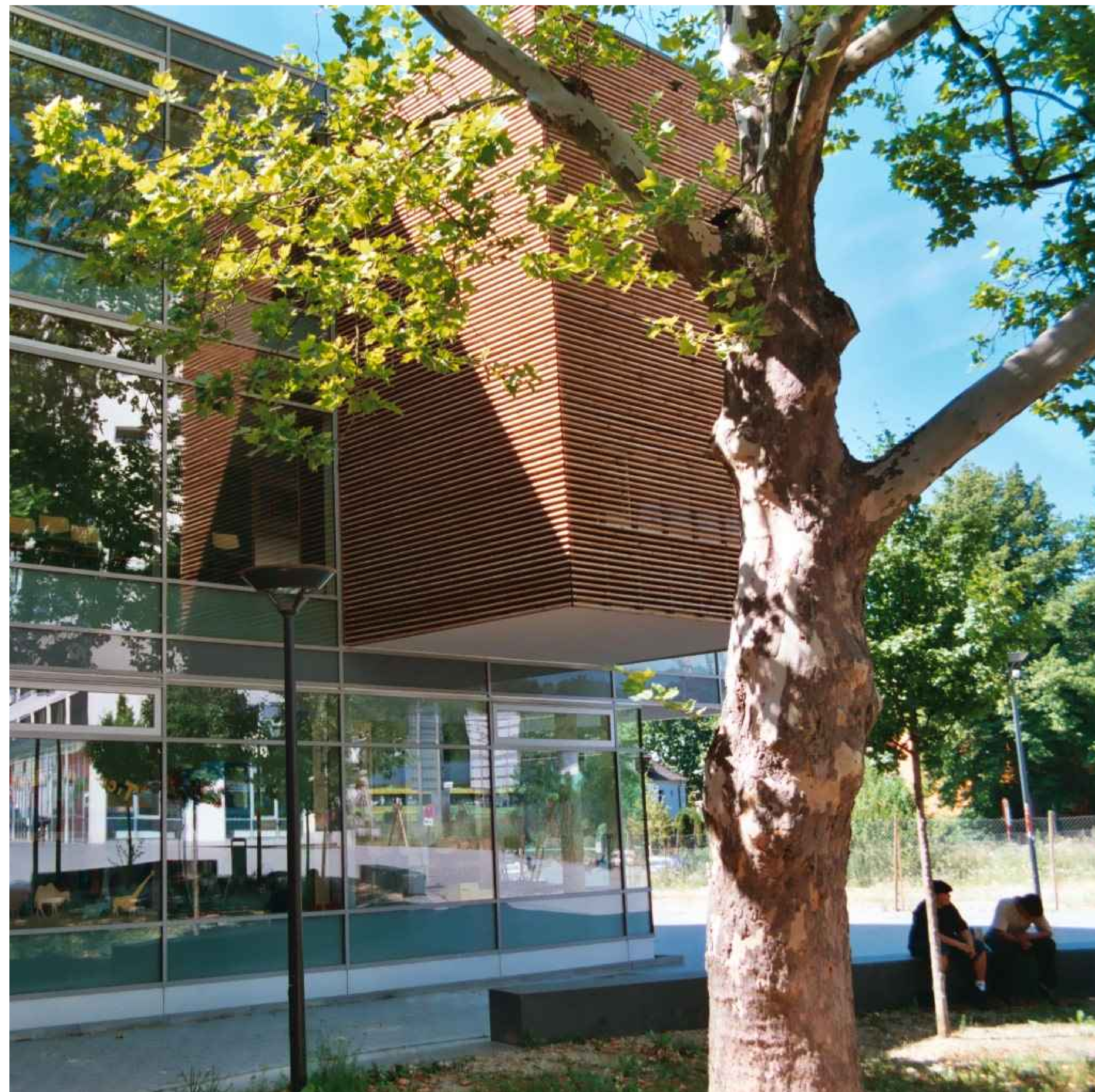
Karoline-Kaspar-Grundschule Seitentrakt - Side wing of Karoline Kaspar elementary school