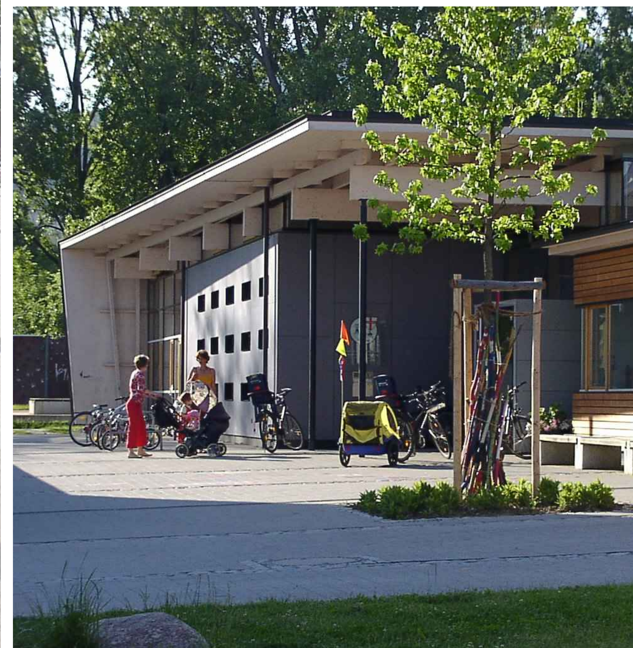
Rahel-Varnhagen-Straße / Kindertagesstätte - Day-care centre