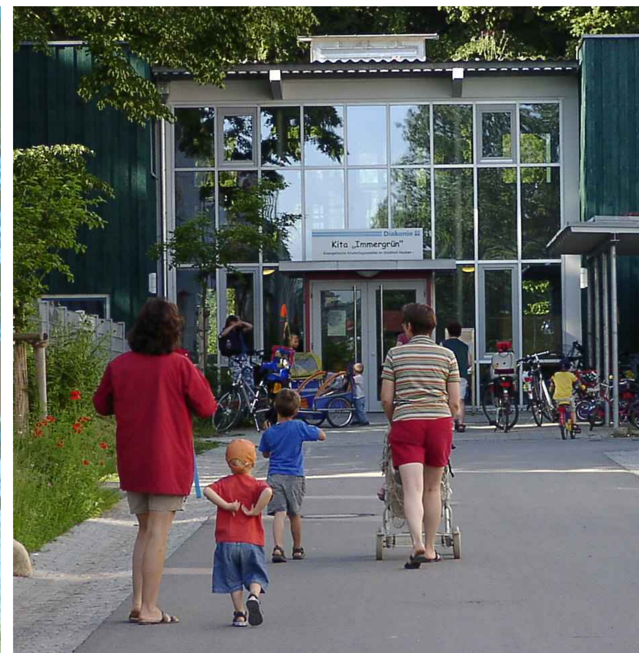
Adinda-Flemmich-Straße / Kindertagesstätte - Day-care centre