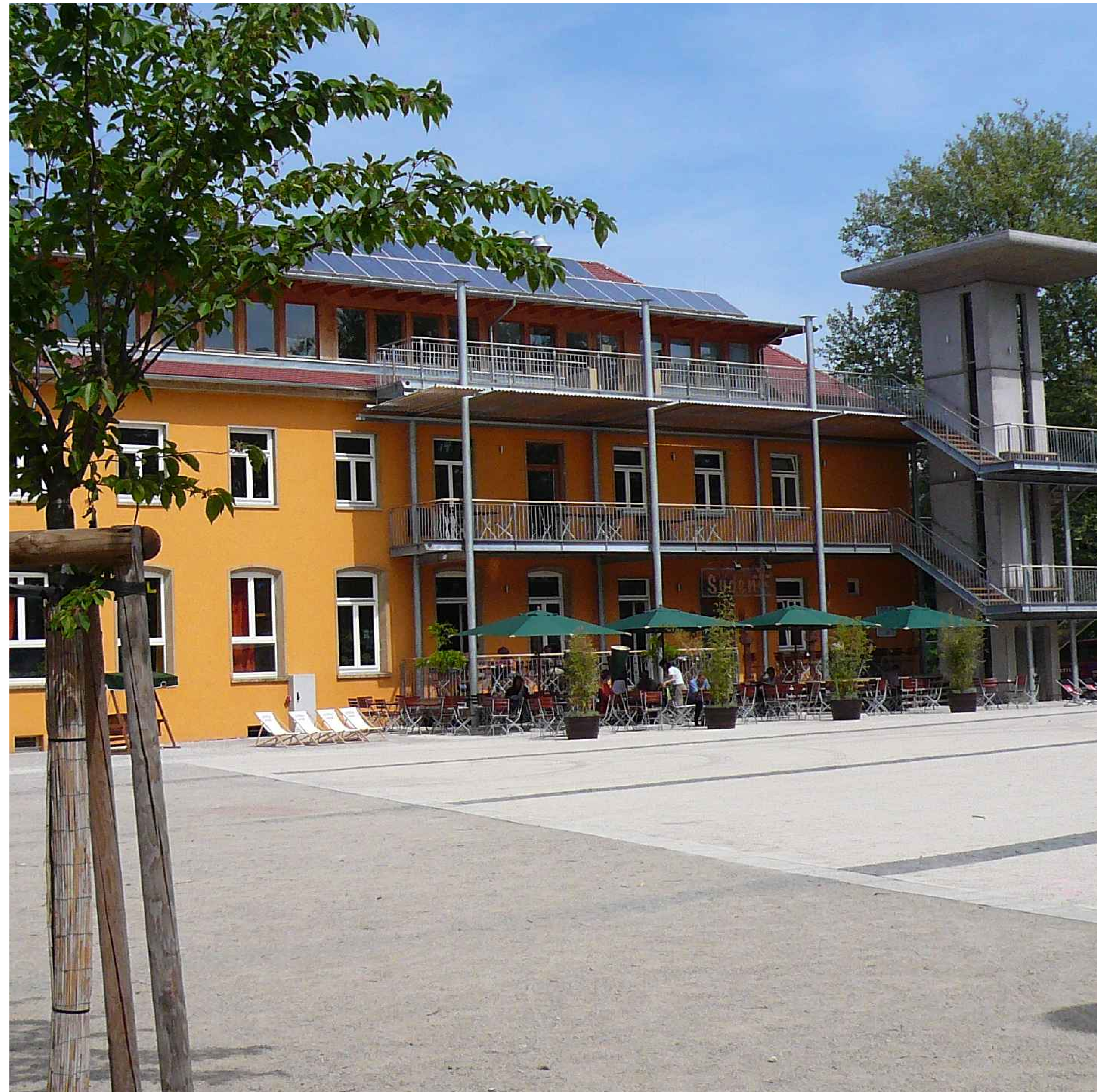
Alfred-Döblin-Platz / Bürgerhaus - Community centre

Together with Freiburg's other new part of town, Rieselfeld, the quarter is the one with the youngest average in population and the most children in Freiburg (approx. 30% of the residents are under 18 years).