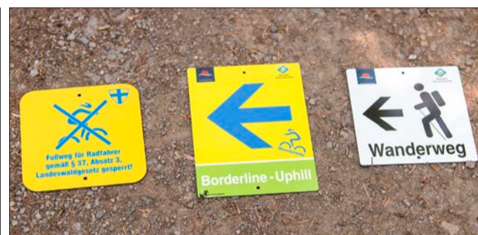
Erlaubt oder nicht? Diese Schilder im Stadtwald helfen Fußgängern und Fahrradfahrern bei der Orientierung.

„Erlaubte Wege“ sind alle, die breiter als zwei Meter sind: Auf ihnen ist Fahrradfahren erlaubt. Ebenso auf schmalen Wegen mit einer gelben Mountainbike-Beschilderung; sie sind positiv für Fahrradfahrer ausgewiesen. Auf allen anderen schmalen Wegen ist Radfahren nicht erlaubt, manche sind auch „negativ“ ausgeschildert, etwa durch ein Schild mit durchgestrichenem Mountainbike oder eine Absperrung aus Holz: „Hier sollen Fahrradfahrer auf keinen Fall fahren, denn das würde nur Konflikte geben“, erklärt die Amtsleiterin. „Zum Beispiel, weil der Weg erosionsgefährdet ist oder weil hier, wie etwa auf dem Sägännleweg in Littenweiler, viele Familien mit kleinen Kindern laufen.“