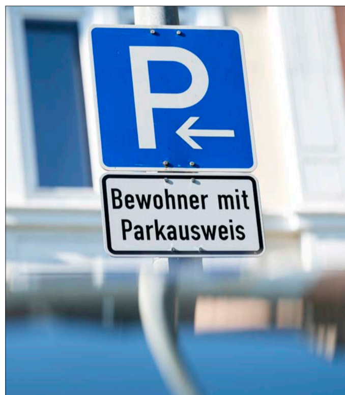
Doppelschlag: Das Anwohnerparken wird nicht nur ausgeweitet, sondern auch drastisch teurer. Mehreinnahmen gibt es auf jeden Fall – ob der gewünschte Lenkungseffekt eintritt, muss sich noch erweisen.

Dessen Kosten hat bislang eine bundesweit geltende Gebührenordnung geregelt. Höchstens 30 Euro pro Jahr waren demnach zulässig – exakt so viel kostet der Ausweis in Freiburg seit 1993. 2020 ist eine Änderung der Straßenverkehrsordnung in Kraft getreten, aus der sich ein deutlich höherer Gestaltungsspielraum ergibt. Obwohl die konkrete Ausgestaltung des Landes noch fehlt, hatte die Verwaltung im Haushaltsentwurf bereits Mehreinnahmen von einer Million Euro pro Jahr vorgesehen – das entspricht etwa einer Vervielfachung des bisherigen Betrags. Angesichts der gewünschten Lenkungswirkung und zur Finanzierung von Projekten der Verkehrswende hatten die Grünen, Eine Stadt für alle und Jupi einen Haushaltsantrag gestellt, auf die Million der Verwaltung weitere 2,8 Millionen Euro draufzusatteln – und in der zweiten Lesung dafür eine Mehrheit erhalten. Diesen Beschluss stellten SPD/Kulturli-