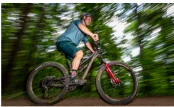
Im Dialog: Mountainbiker im Stadtwald und das Forstamt. Mehr dazu auf Seite 7.

Streitbar: Dritte Lesung der Haushaltsberatungen