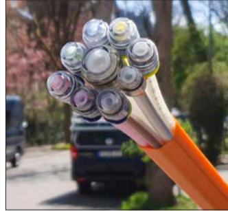
Schneller surfen: So sehen Glasfaserkabel aus.

Bandbreiten angewiesen.“ Um den Anschluss der rund 11000 Haushalte mit einer Geschwindigkeit von bis zu einem Gigabyte pro Sekunde in der Wiehre und im Rieselfeld schnell zu ermöglichen, arbeiteten die Telekom und das Garten- und Tiefbauamt mit dem Amt für Digitales und IT eng zusammen. Genehmigungen können so schneller ausgestellt werden.