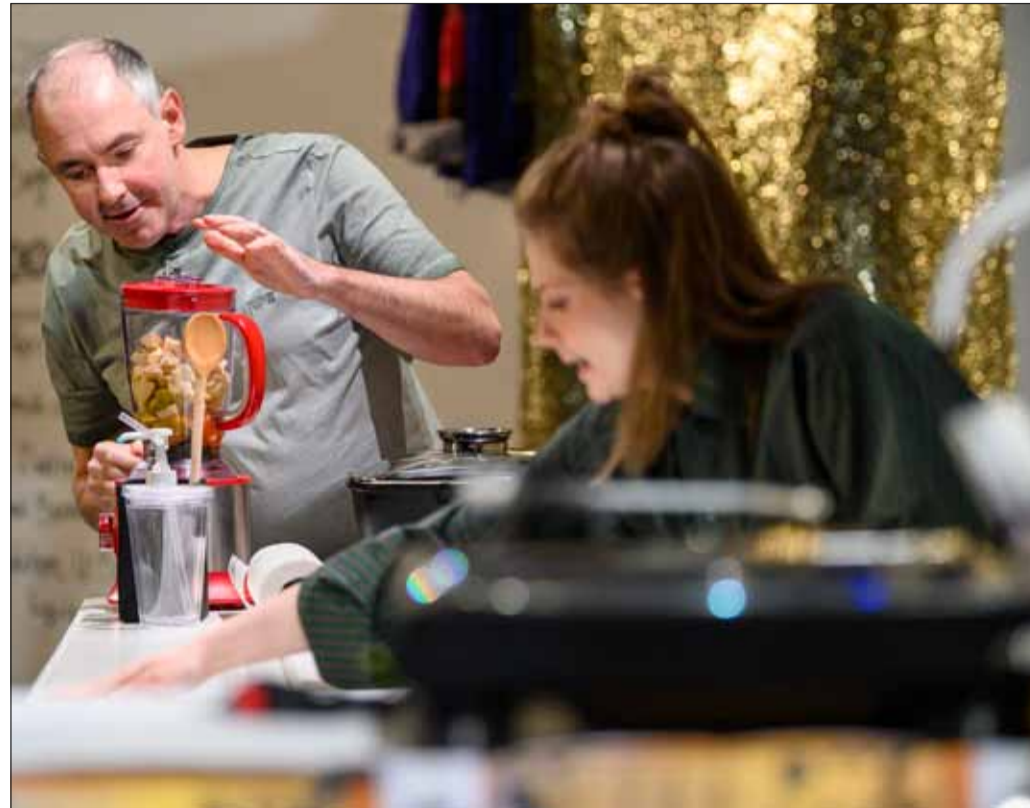
Kochen, mal anders: Als Lucie einen Nebenjob annimmt, ahnt sie nicht, was sie erwartet. Wird hier wirklich nur ein Smoothie gemixt? Oder doch ein Liebestrank...

Lucie ist zwölf Jahre alt – und mächtig verärgert. Das Leben ist unerträglich geworden, seit der neue Lebensgefährte ihrer Mutter eingezogen ist.