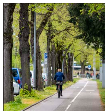
Je zwei Meter breit sollen Rad- und Fußweg hier künftig sein.

Der ursprüngliche Plan der Verwaltung, den Radweg auf dem rund 300 Meter langen Stück an der Friedhofsmauer auf seiner aktuellen Breite von