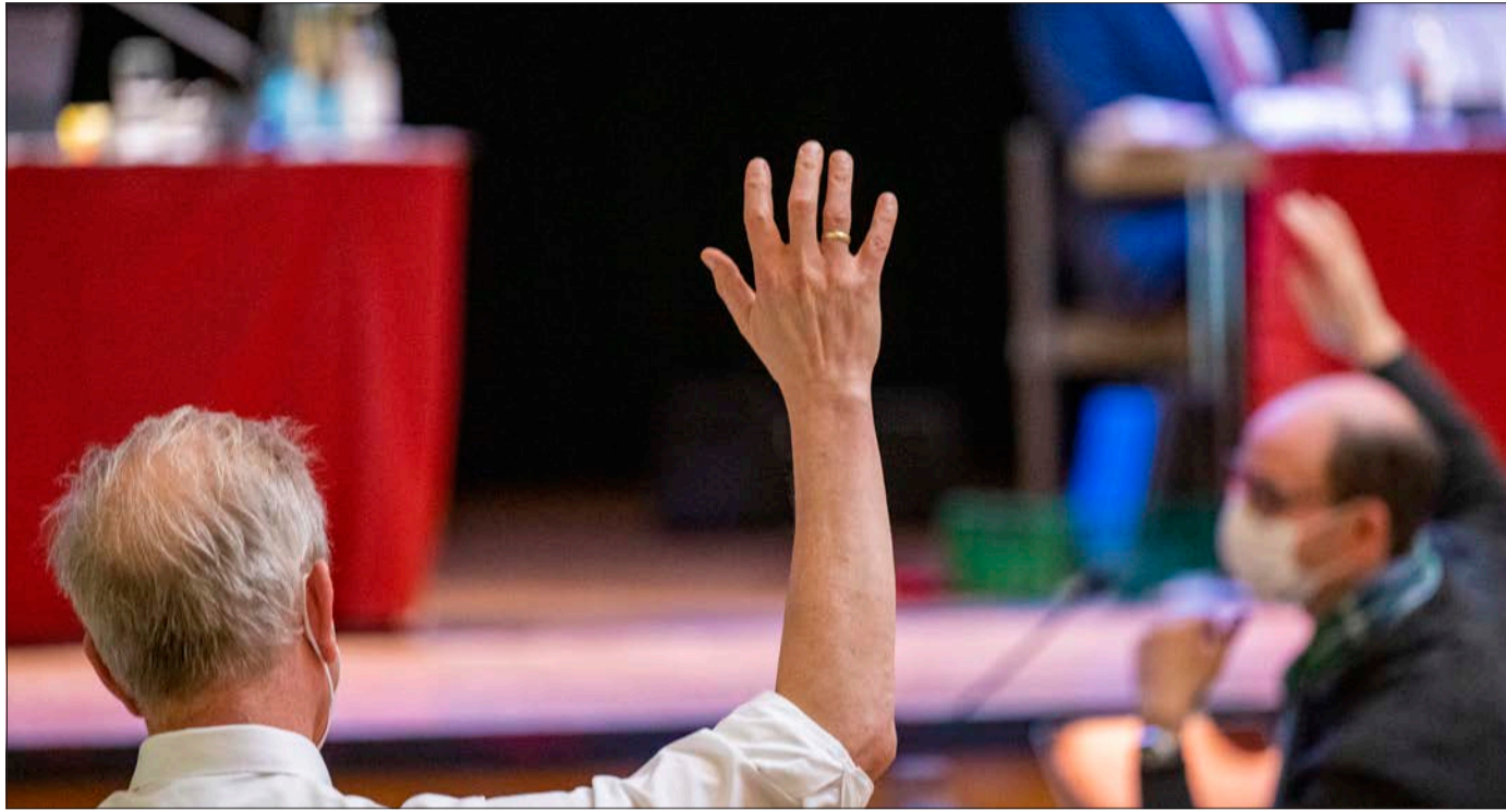
Dafür oder dagegen: In der dritten Lesung sind nochmals viele Abstimmungen notwendig.

Heftig umstritten ist auch die die personelle „Abrüstung“ des Vollzugsdienstes: Hier wird in der dritten Lesung abermals diskutiert und am Ende na-