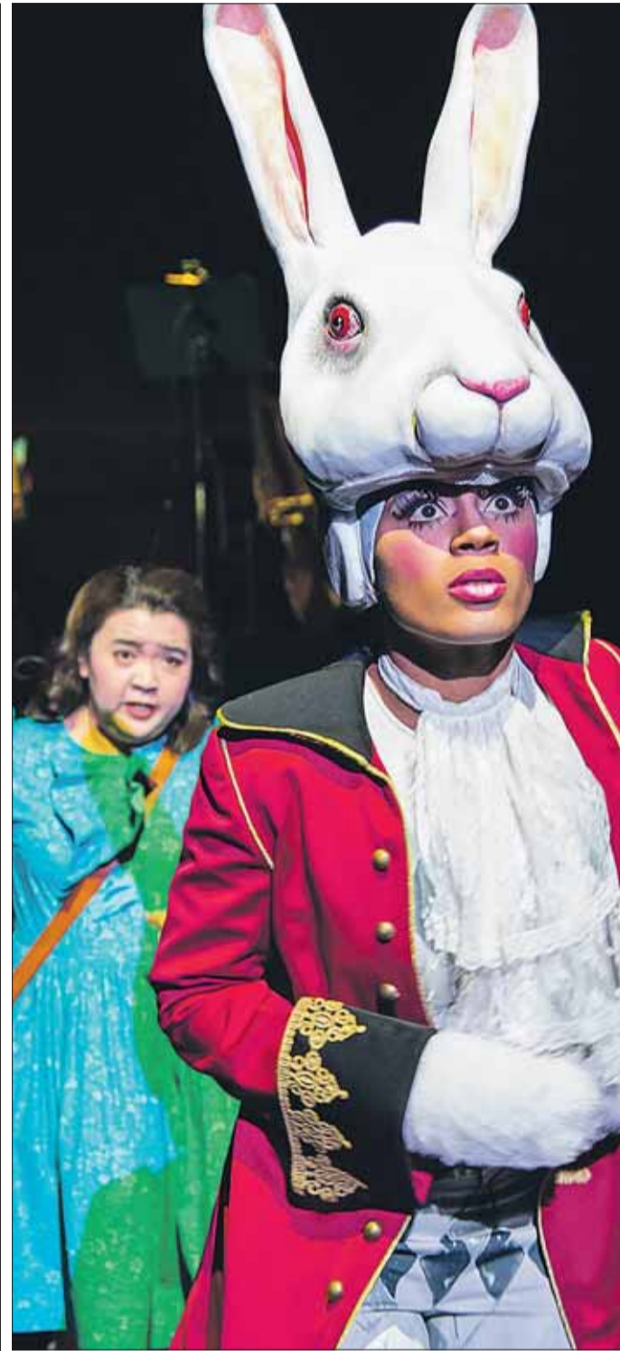
Kostümwechsel der Superlative: Mit drei Darstellenden sechzehn verschiedene Rollen auf die Bühne zu bringen, ist eine besondere Herausforderung.

Das Wunderland von Alice ist ein Stück übers Erwachsenwerden