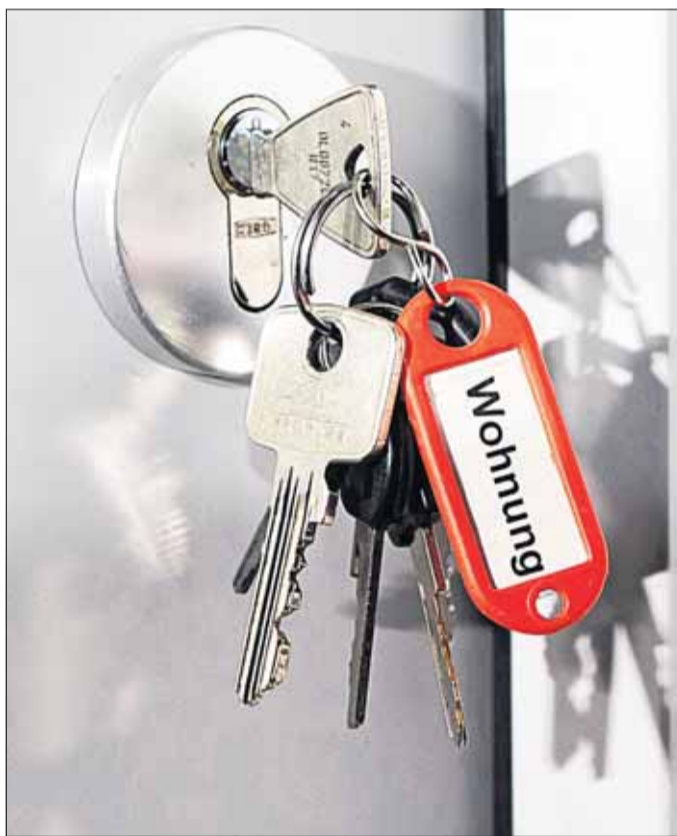
Schlüssel finden: Die Schaffung bezahlbaren Wohnraums ist die Kernaufgabe der kommenden Jahre.

Ein städtisches Kerninstrument zur Schaffung und Erhal-