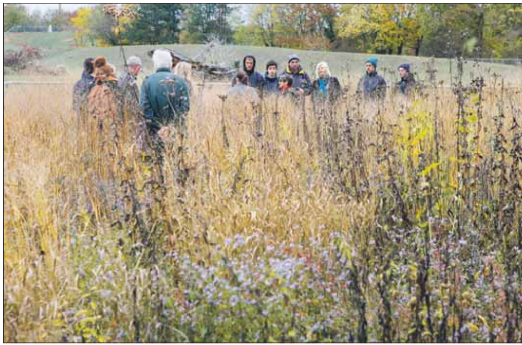
Wer ist denn da? In den Hochgräsern der neuen Prärie gehen die Mundenhofbesucherinnen und -besucher fast gänzlich unter. Derweil lugt der Bisonbulle neugierig zur Prärie-Wiese rüber.

Vor einem Jahr ist sie selbst vor Ort gewesen und hat sich in Madison mit Forschern und Gärtnern über passende Steppengräser für das Freiburger Klima ausgetauscht. Aufgrund immer längerer Trockenperioden kommen Präriepflanzen