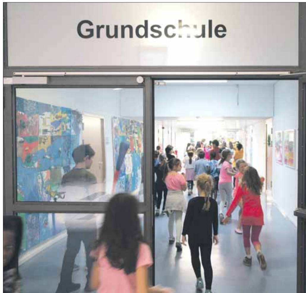
So bunt wie das Leben: Die Vigelius-I-Grundschule in Haslach ist so ausgestattet, dass Schülerinnen und Schüler möglichst individuell lernen können.