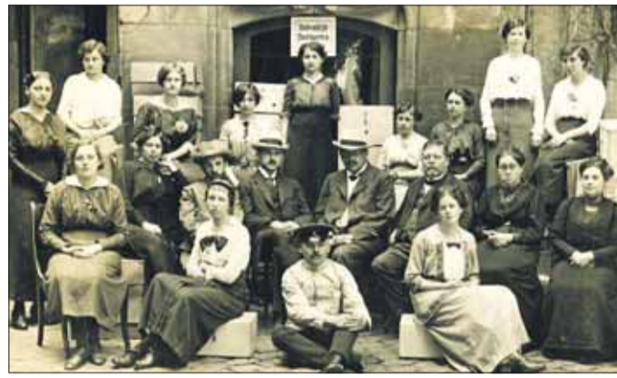
Gegen die Alltagsnot: Die Beschäftigten des städtischen Lebensmittelamtes im Hof des Rathauses im Jahr 1915.

Am Sonntag, 18. November lädt das Familienzentrum Klara e.V. zum Dialog mit Sonntagsuppe ein. Dabei wird darüber diskutiert, welchen Stellenwert einst heiß erkämpfter Meilensteine der Demokratisierung heute haben. Verliert etwas für junge Frauen Selbstverständliches an Wert oder Bedeutung? Wie können wir es schaffen,