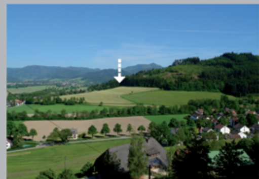
der neue Standort - am alten Weg zur Erzwäscherei

Kunst-und Kulturverein Freiburg-Kappel e.V.