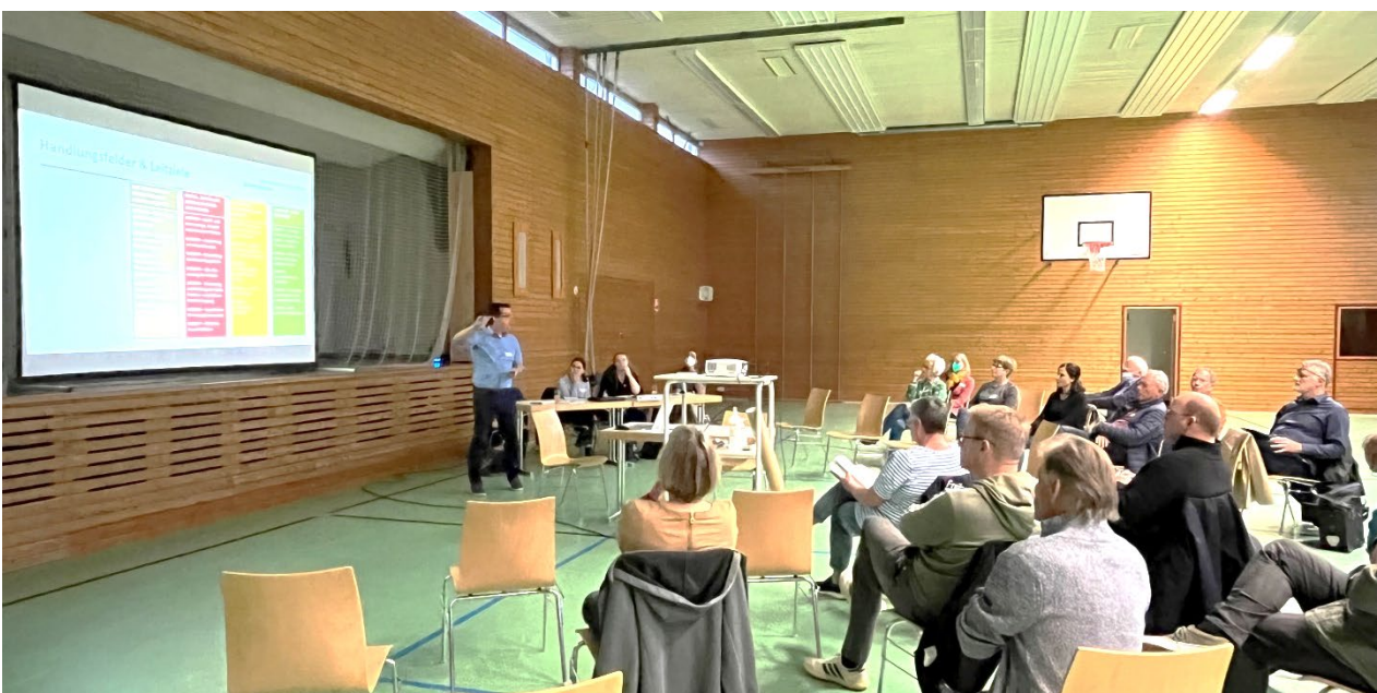
Abbildungen: Impressionen der Tuniberg-Werkstatt in der Steinriedhalle Waltershofen