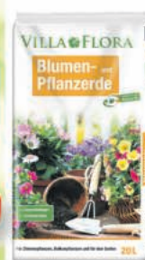
Villa Flora Blumen- erde 20-L-Sack (1 L = € 0,15)