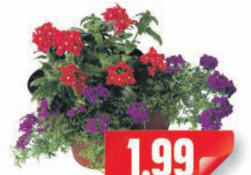
Petunien verschiedene Farben, Topf