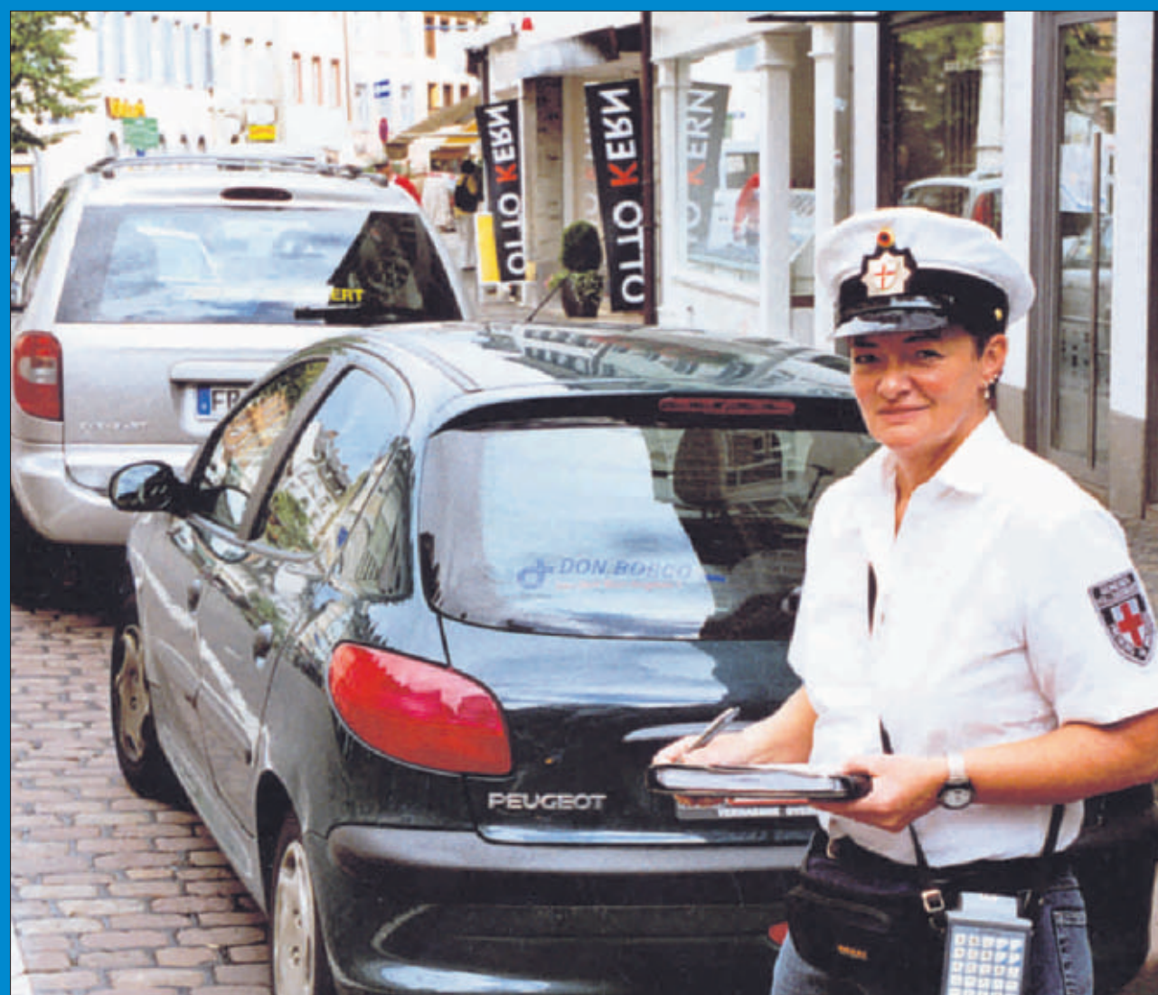
Eine Außendienstmitarbeiterin des Gemeindevollzugsdienstes im Einsatz in der Innenstadt

Wahrscheinlich hat jede und jeder in seinem Leben schon einmal ein „Knöllchen“ bekommen – sei es für falsches Parken, zu schnelles Fahren oder weil die Ampel schon auf „Rot“ stand. In Freiburg kümmern sich seit über 40 Jahren Gemeindevollzugsdienst und Bußgeldbehörde um diese kleineren und größeren Sünden. Das Amtsblatt hat ihnen bei ihrer täglichen Arbeit über die Schultern geschaut und stellt diese Tätigkeiten des Amtes für öffentliche Ordnung auf einer Doppelseite vor.