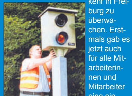
Regelmäßig müssen die Filme der Kameras gewechselt werden

Als Anfang der 60er-Jahre die Fahrzeugdichte und damit auch die Zahl der Falschparker stark zunahm, wurde 1964 der Gemeindevollzugsdienst gegründet, um der Polizei bei ihren vielfältigen Überwachungsaufgaben zur Seite zu stehen. Der zunächst drei Mann starke Trupp bekam 1973 erheblichen Zuwachs, weil sich mit der Einführung der Fußgängerzone die Aufgabenbereiche vervielfachten. Fortan waren 28 Personen im 3-Schicht-System damit beschäftigt, dem ruhenden Ver-