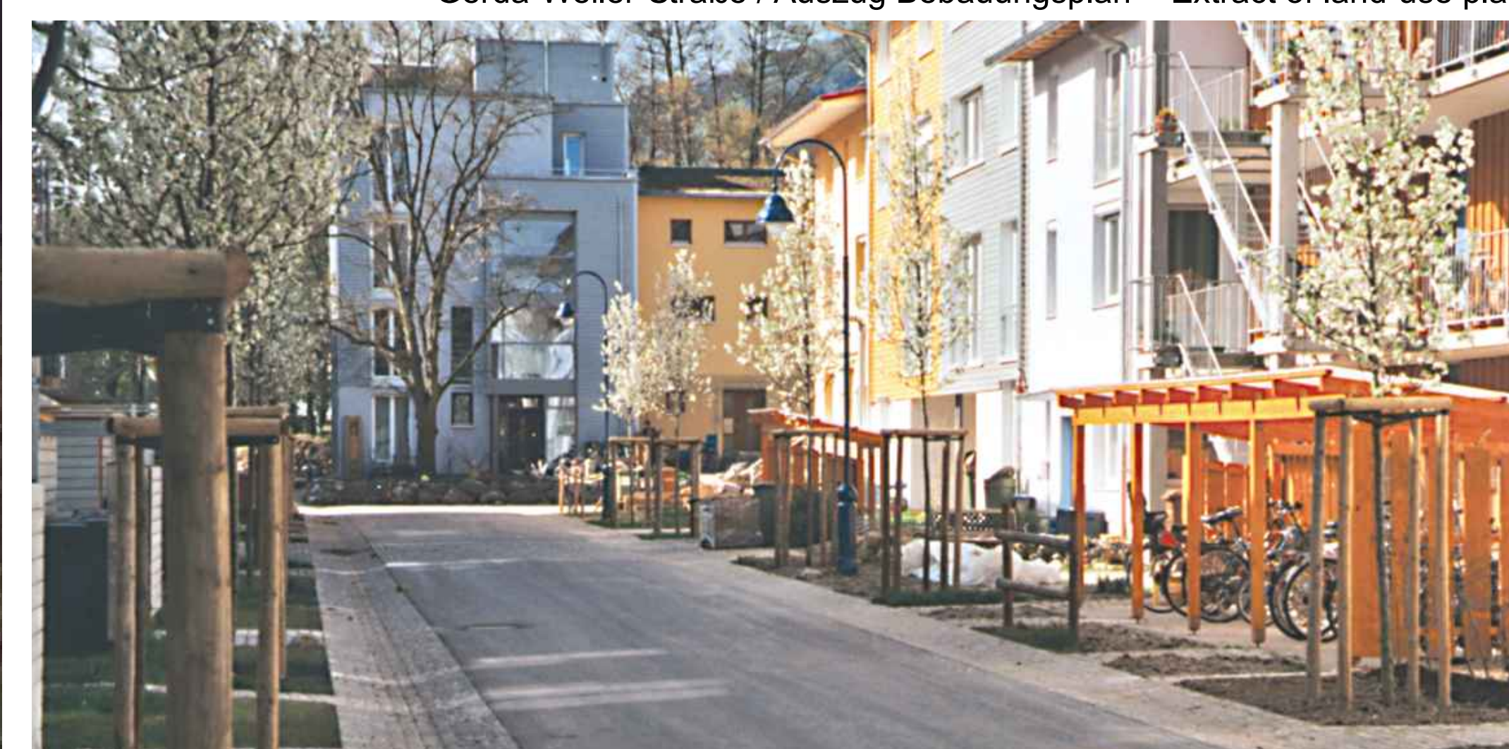
Gerda-Weiler-Straße 2004 - Gerda-Weiler-Straße in 2004