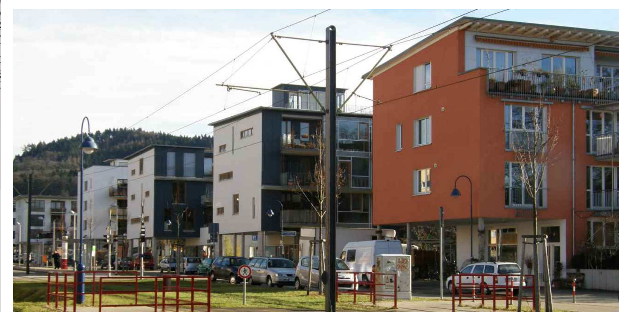
Vaubanallee / Mehrfamilienhäuser - Multiple-family houses