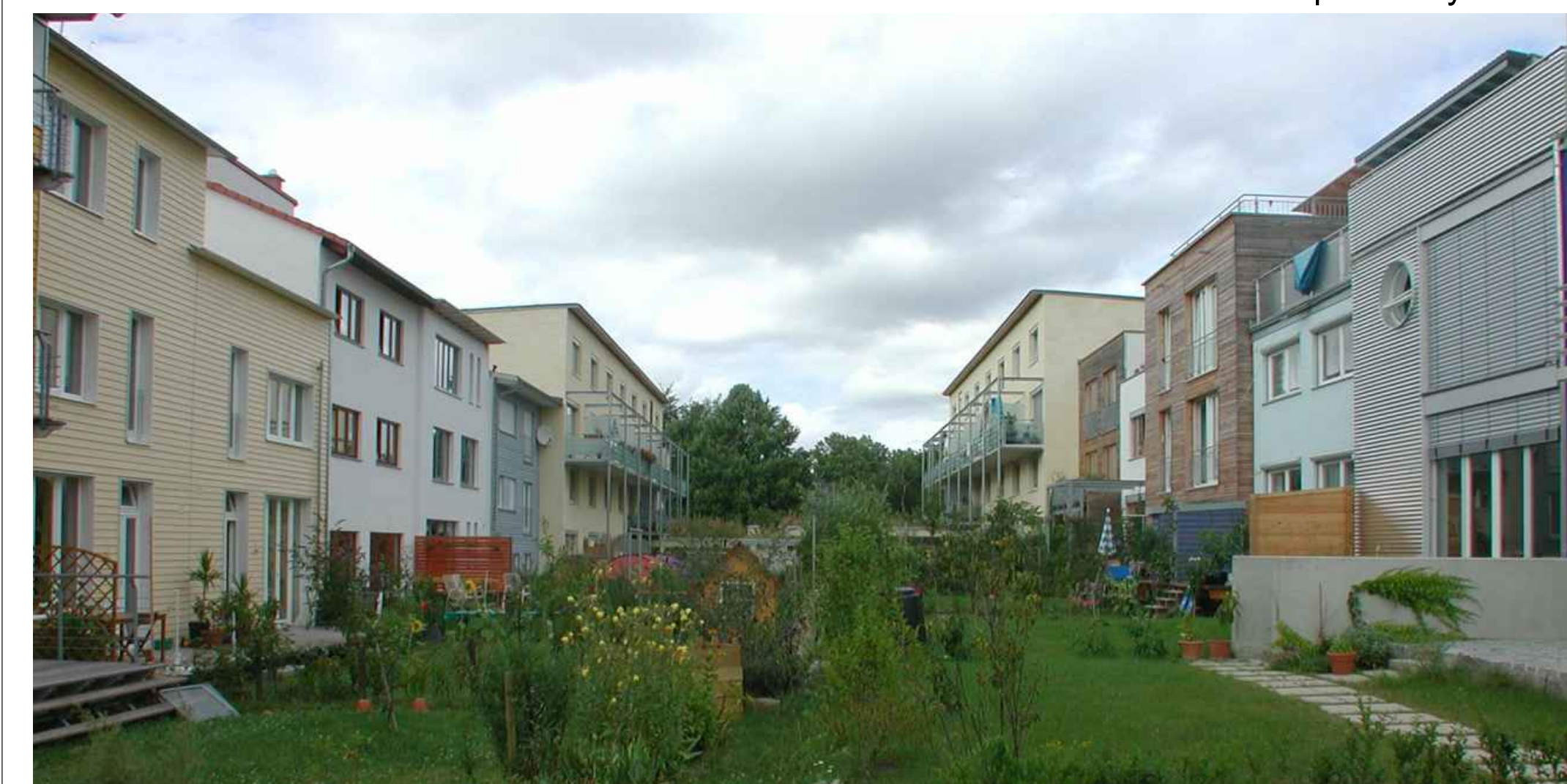
Rahel-Varnhagen-Straße / Privatgärten - Backyards