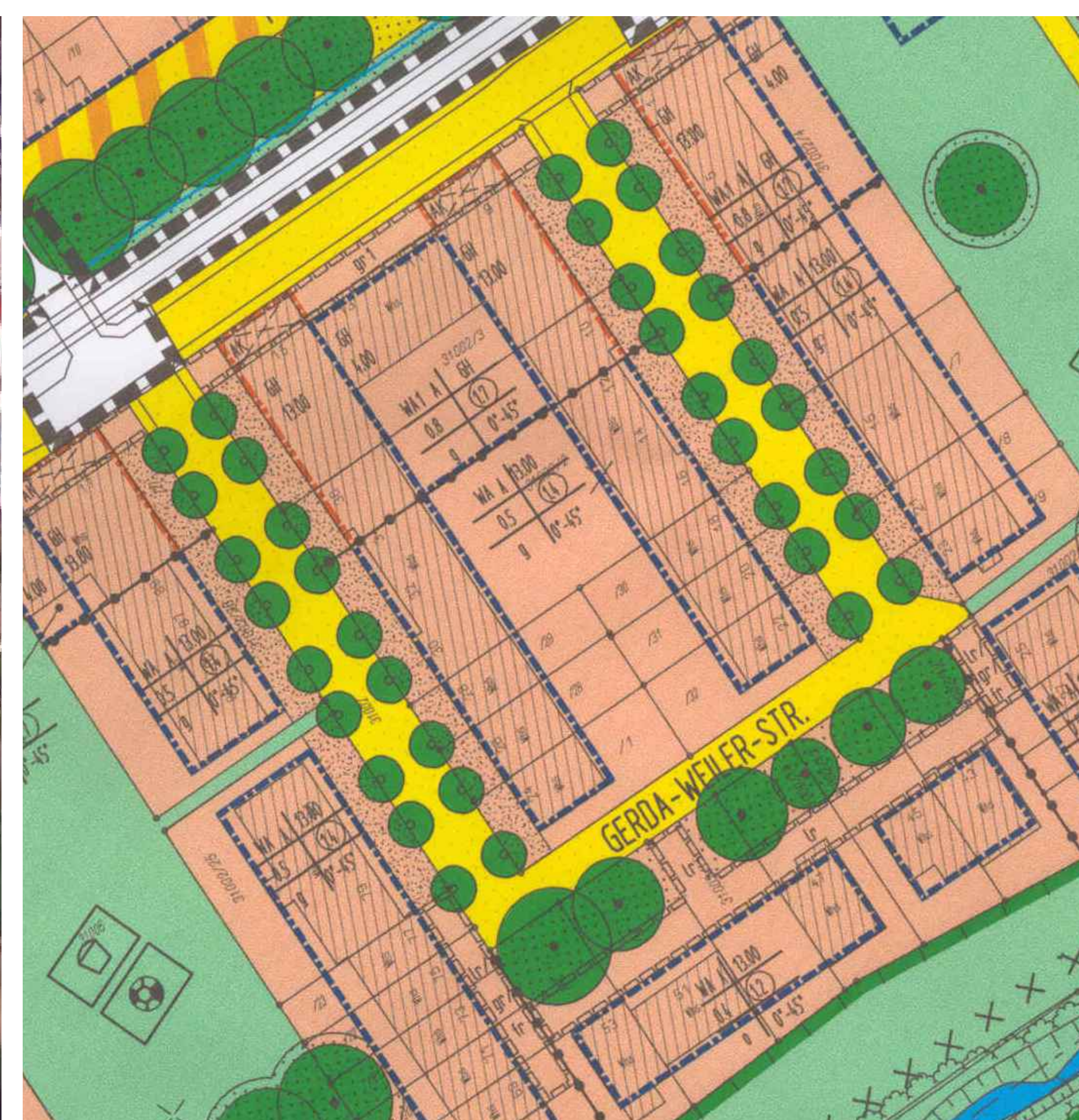
Gerda-Weiler-Straße / Auszug Bebauungsplan - Extract of land-use plan