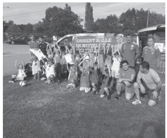
Das DFB-Team mit den „Jungstars“

Am vergangenen Donnerstag feierte der SV Waltershofen zum Saisonabschluss bei strahlendem Sonnenschein sein jährliches Jugendgrillfest. Bei dieser Gelegenheit ehrt der Verein seine freiwilligen Jugendtrainer, die das ganze Jahr die Kinder des Dorfes fußballerisch betreuen. Als besondere Attraktion wurde dieses Jahr das DFB-Mobil engagiert, um der F-Jugend die neuesten Trainingsmethoden und Übungen vorzustellen. Unter der fachkundigen Anleitung des Trainerteams des DFB liefen, schossen und schwitzten unsere Jungstars fast zwei Stunden auf dem Feld, während sich Eltern und Freunde bei Essen und Trinken vergnügten. Die neue Saison 2015/16 kann kommen!