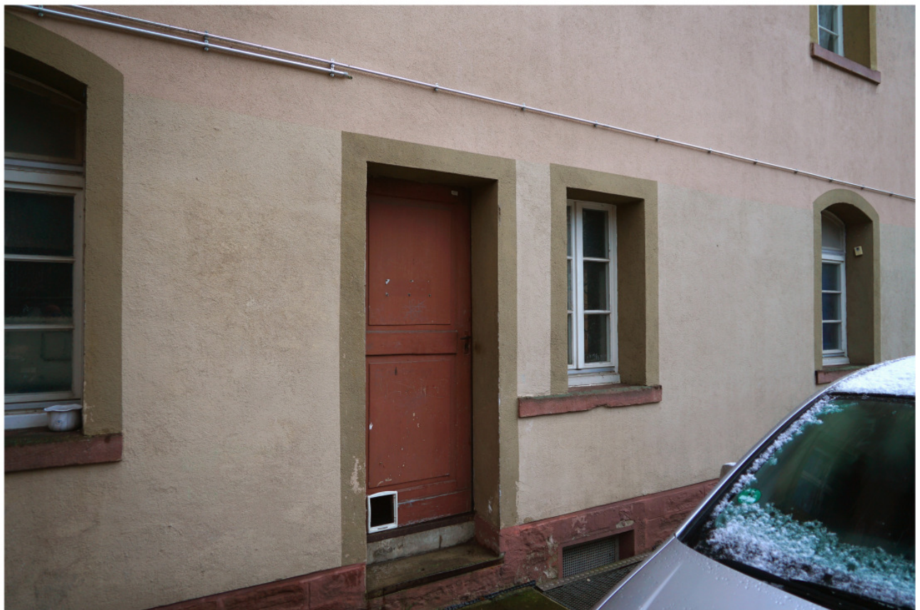
Simsstein einer erdgeschossigen Fensteröffnung an der nördlichen Längsseite, beim Einbau der Zugangstür zum Keller verschmälert