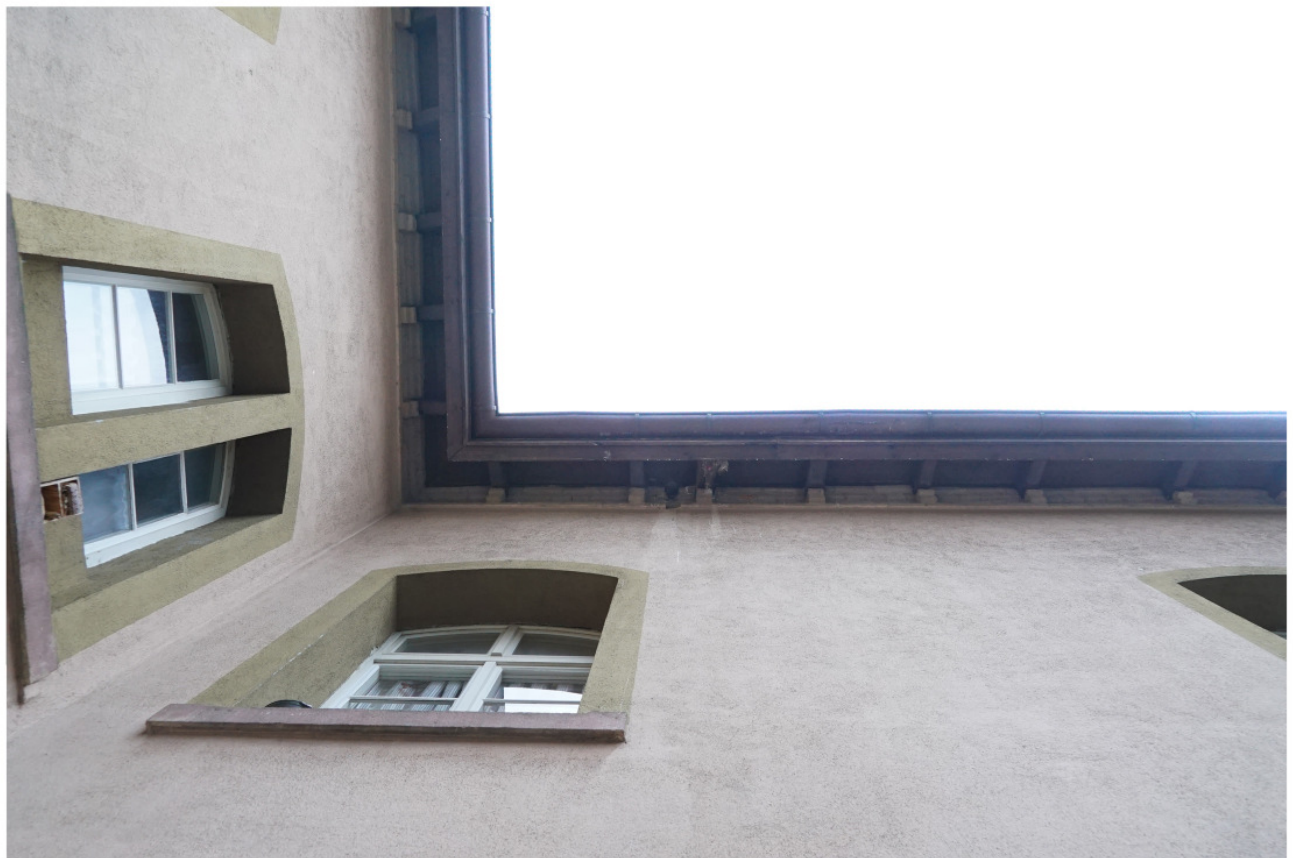
Ecke zwischen dem Vorbau (links) und nördlicher Traufseite mit enger Sparrenstellung und darin befindlichen Ausparungen für eine Rohrleitung o.ä.