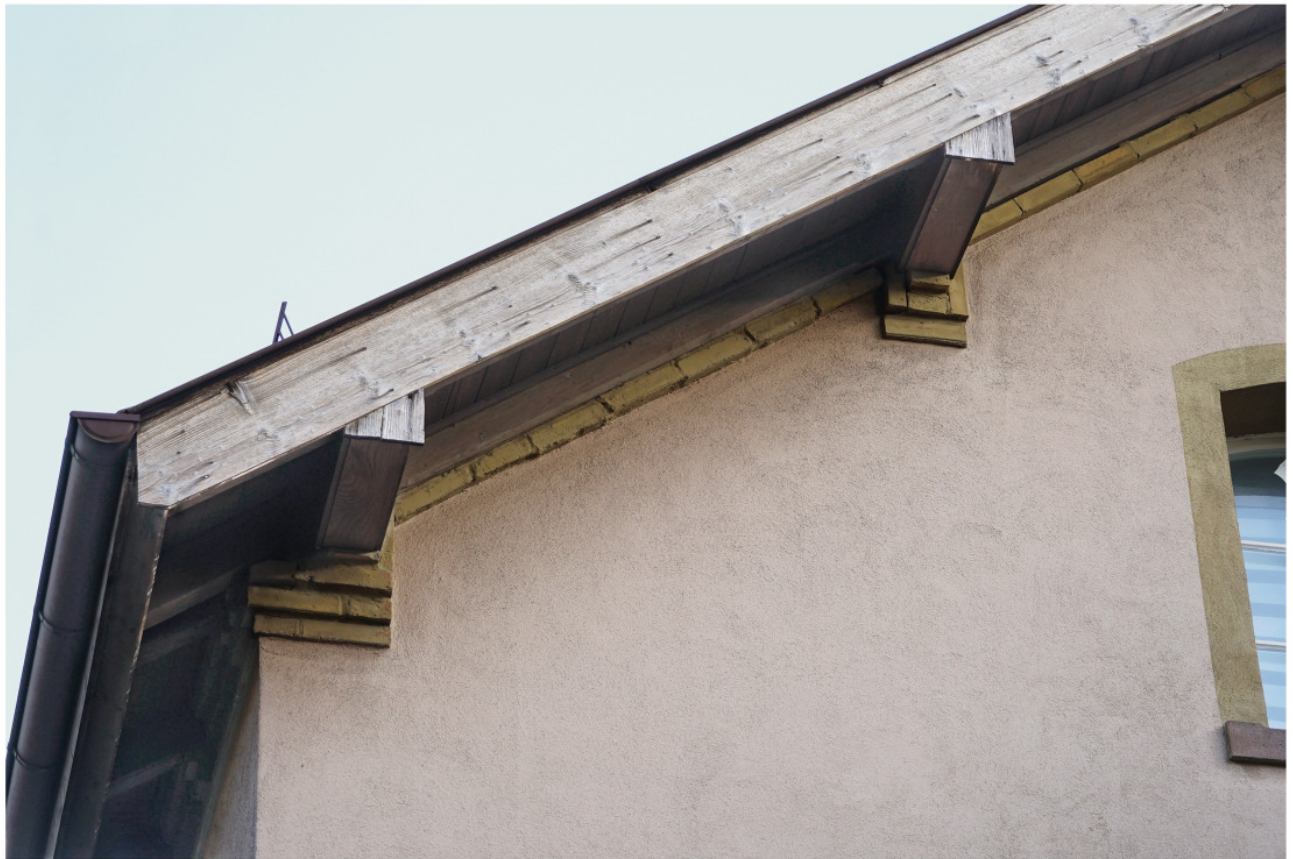
Traubereich an der Nordwestecke mit Konsolen unter den Kragbalken und Mauerkrone der Giebelwand aus Backsteinen