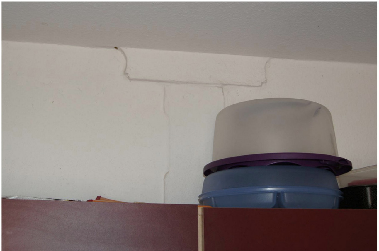
Wie Abb. 13, Sattelholz mit Zierschnitt und Ständer mit aussetzenden Fasern zum Anschluss nicht mehr vorhandener Kopfstreben