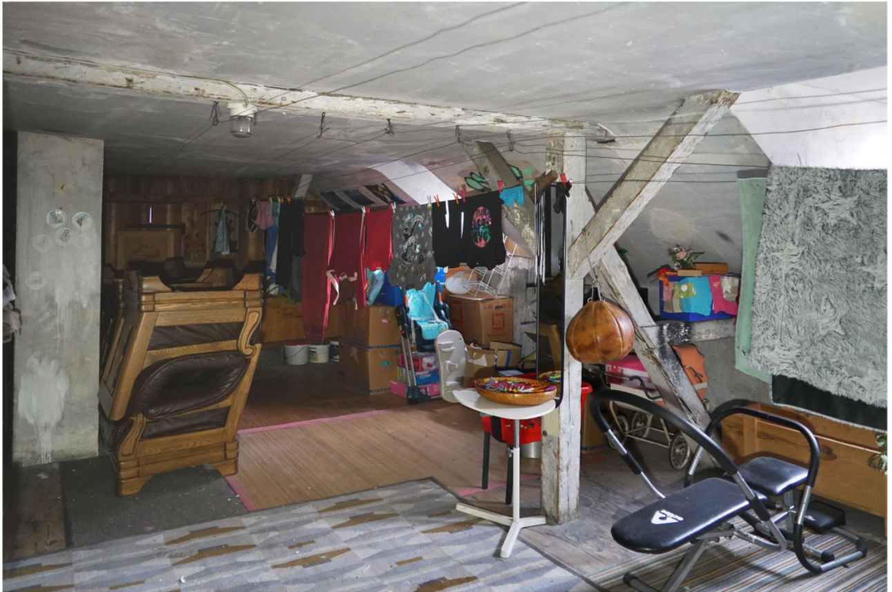
Speicherraum im 2. Obergeschoss auf der Ostseite mit Drepel und stehendem Stuhl, bauzeitlich ausgebaut Saal mit Putz an Decke und Dachschrägen