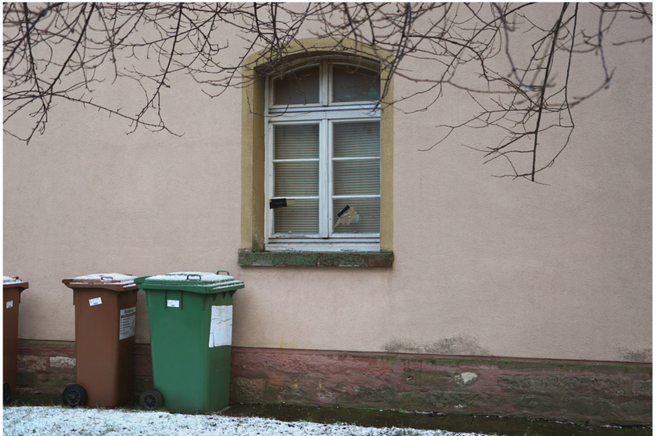
Zurückgearbeitete Türschwelle innerhalb des Sockelbereichs unterhalb der erdgeschossigen Fensteröffnung mittig in der westlichen Giebelwand