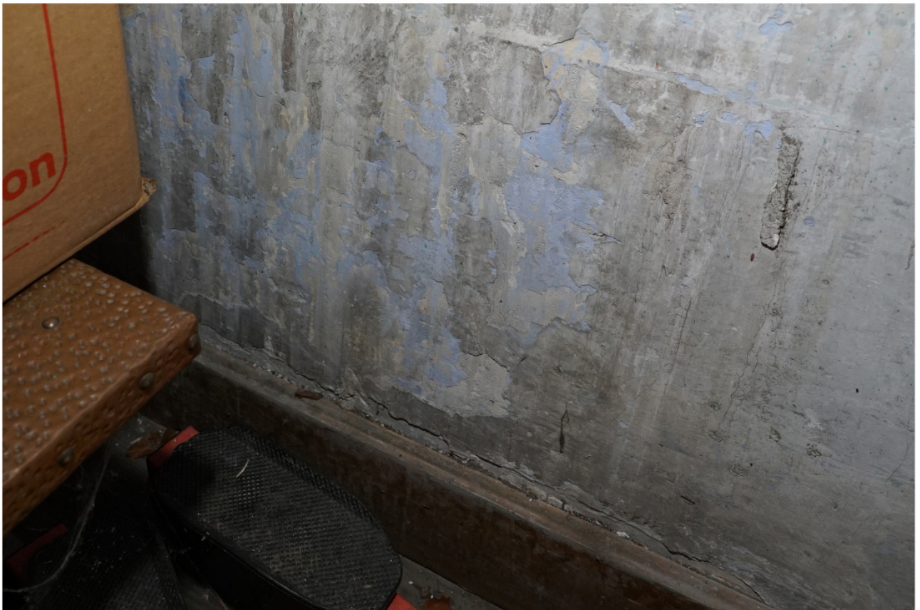
Wie Abb. 7, an der Drempe/wand sichtbare werdende frühere Wandfassung in Hellblau