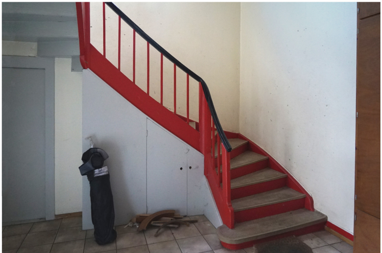
Wie Abb. 5, Antritt im Erdgeschoss 6