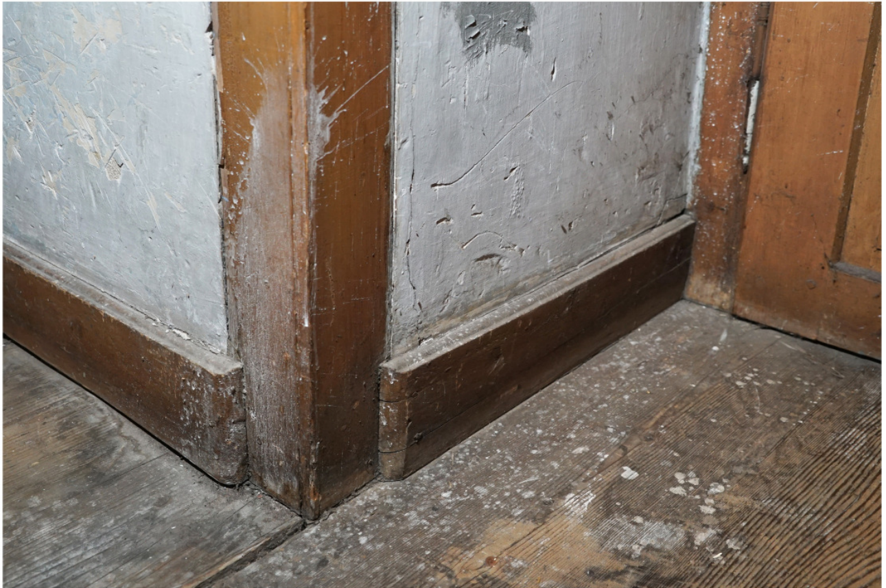
Wie Abb. 9, profilierte Sockelbretter mit Anschluss an brettverschalte Ecke