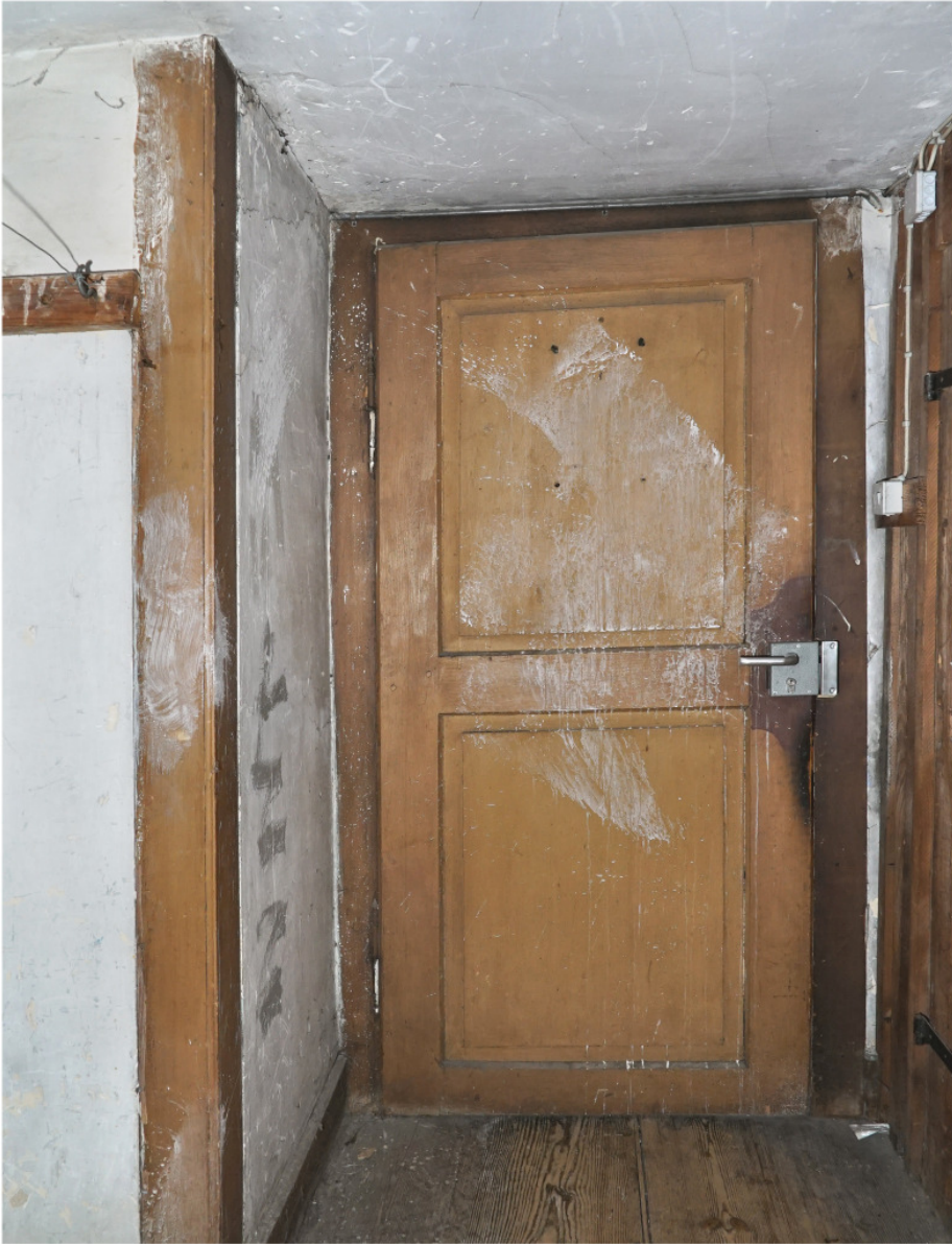
Wie Abb. 7, Kassettentür und brettverkleidete Raumkante