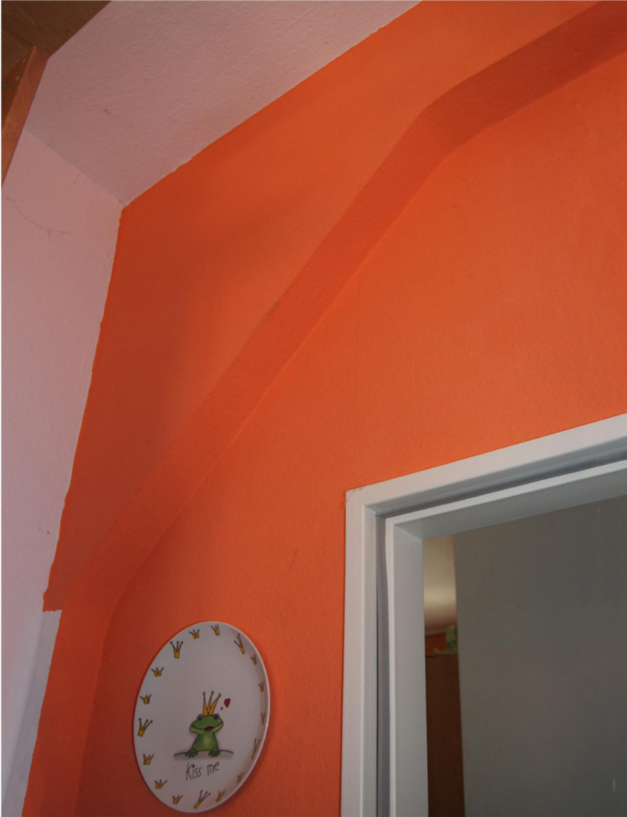
Kopfstrebe in der östlichen Wohnung des Obergeschosses 15

Freiburg, Knopfhäusle, Schwarzwaldstraße 60