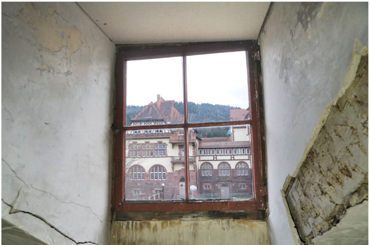
Wie Abb. 7, Fenster einer der Dachgauben auf der Südseite