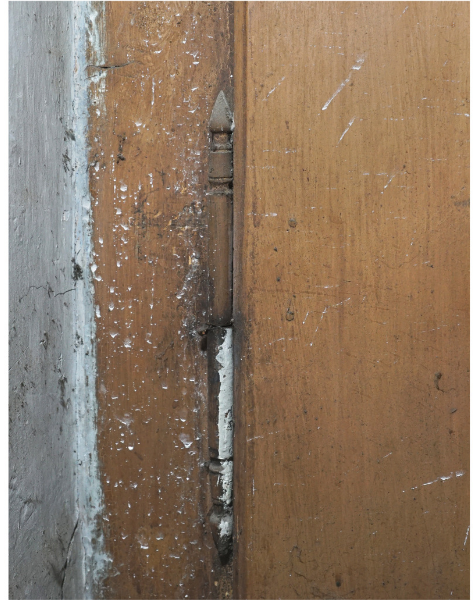
Wie Abb. 9, Fitschelband