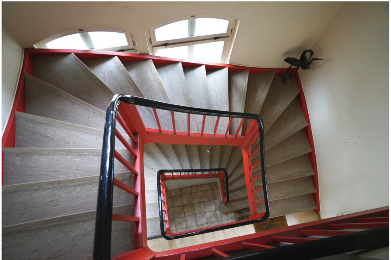
Innentreppe innerhalb des Querbaus an der Nordseite, Blick vom 2. Obergeschoss nach unten 5