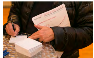
1. Informationsveranstaltung am 21. Oktober 2015