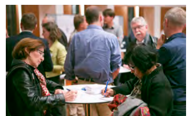
2. Informationsveranstaltung am 10. November 2015; Fotos: A. Schmidt