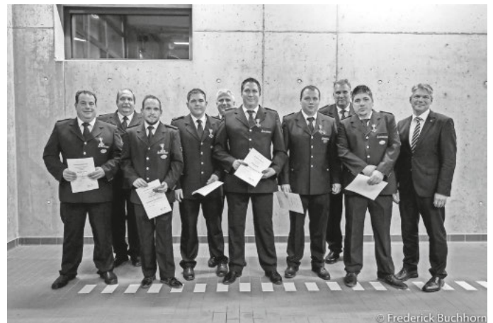
Ehrung 15 Jahre Feuerwehrdienst