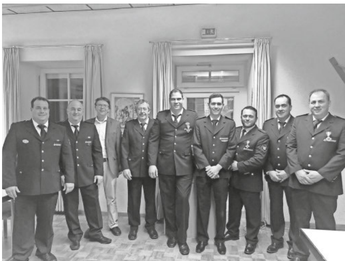
Ehrungen und Beförderungen am 18.01.2019