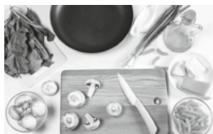
Foto: "Kochkurs zum Thema 'Gesundessen' - Praktikum mit Fleis, Leinwand, Spind, Öl, Knoblauch' von Hans-Veronika-Bildende CC BY 2.0

Im Jugendzentrum Hochdorf (Riedmatten 6, 79108 Freiburg-Hochdorf)