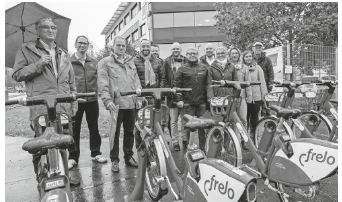
Initiatoren und Sponsoren der neuen Frelo-Stationen im Gewerbegebiet / GIP.

Natürlich sind die Frelos für alle nutzbar, und nicht nur für die Beschäftigten der sechs Unternehmen, die sich finanziell beteiligen.