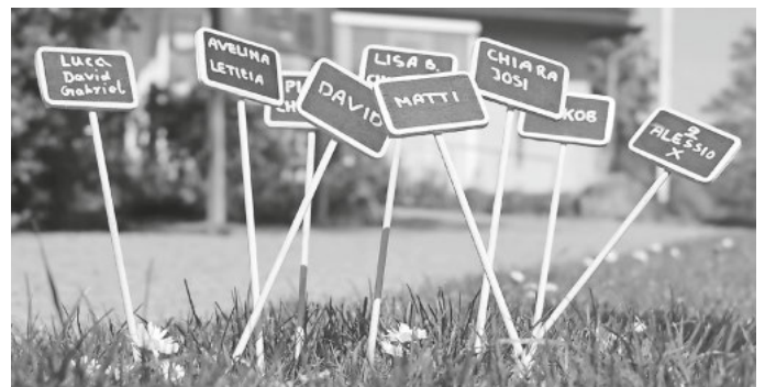
Namenstafelchen auf den Bienenweiden.

Auf dem Gelände rund um das Katharina-von-Bora-Haus gegenüber des Hallenbads tut sich zurzeit einiges. Unter anderem sind Mitglieder der Gartengruppe der evangelischen Gemeinde gerade dabei, auf städtischem Gelände am Rande des Weges „am Bänkle“ gegenüber der Mühlmatenschule Blumenbeete für sogenannte „Bienenweiden“ anzulegen.