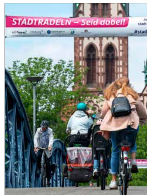
Respekt! Beim Stadtradeln waren die Freiburgerinnen und Freiburger wieder besonders aktiv.

Unter den Teilnehmenden werden nach dem Nachtragezeitraum attraktive Preise wie Radladengutscheine, Fahrradpumpen oder eine Reparaturstation an Einzelpersonen, Teams und Schulen verlost. Wie Freiburg im Vergleich zu