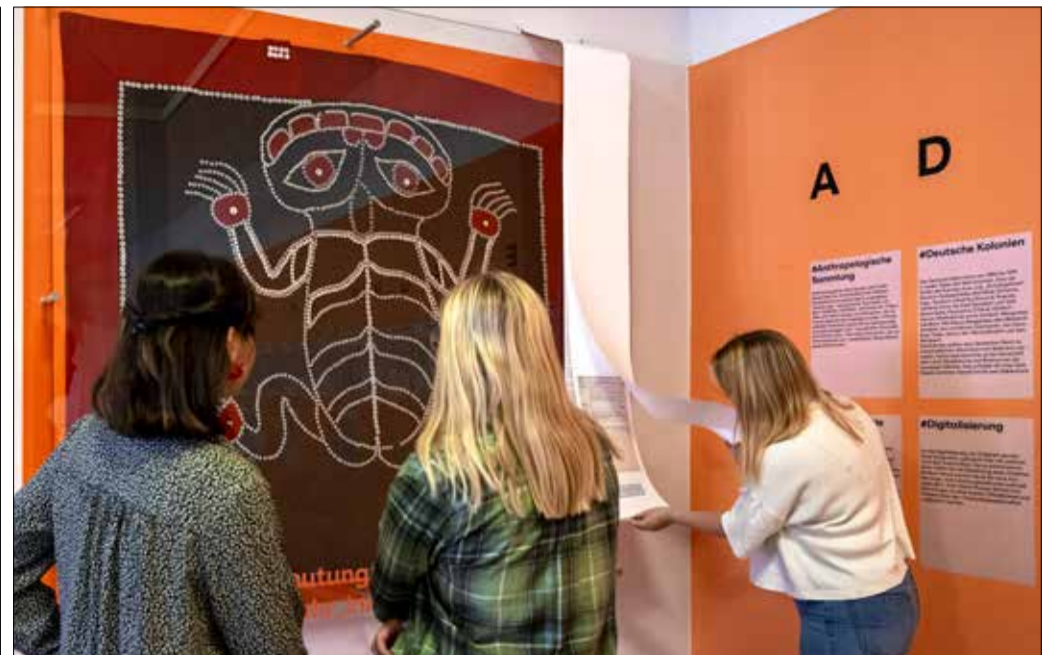
Woher und wohin: Bei allen Objekten der Ausstellung versucht das Museum, die Herkunft und Möglichkeiten der Rückgabe zu klären.

Der verantwortungsvolle Umgang mit jedem Objekt wird zum Beispiel durch semitransparente Wände in den Ausstellungsräumen aufgezeigt und erklärt. Die Art der Darstellung soll laut der