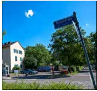
Im Wandel: In Haslach stehen Änderungen an.

G emeinsam mit Anwohnerinnen und Anwohnern will das Stadtplanungsamt in einem Dialogverfahren Entwicklungsleitlinien für das Quartier Belchen-/Blauenstraße entwickeln. Das Quartier befindet sich im Wandel: Es sollen sowohl zusätzlicher und bezahlbarer Wohnraum als auch Grün- und Freiraumflächen geschaffen werden.