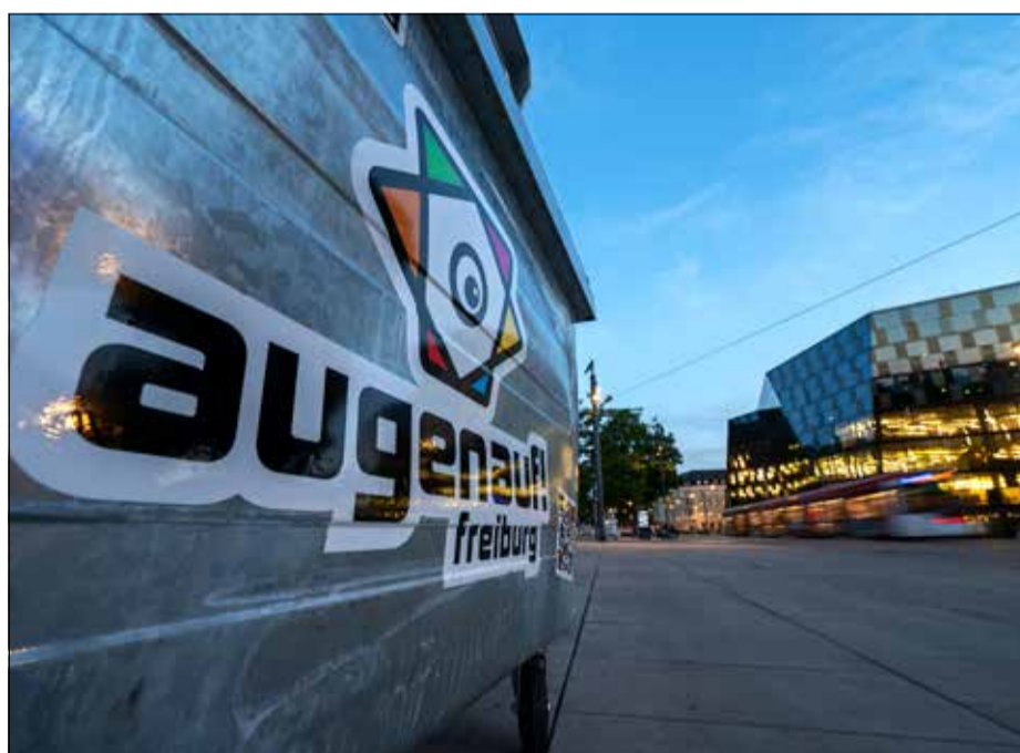
Her mit dem Müll! An zentralen und gern besuchten Plätzen wie dem Platz der Alten Synagoge hat die ASF zusätzliche Müllcontainer aufgestellt. Noch nie war es so leicht, seinen Abfall zu entsorgen.

Außerdem gibt es bis ins Jahr 2023 sowohl digital als auch auf den Straßen Freiburgs immer wieder große und kleine Aktionen. Dem Community-Gedanken folgend, laden die Kampagnen-Website und ihr