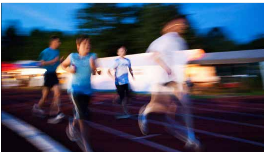
Auch nachts geht's rund: Die Abendstunden im Seepark sind besonders stimmungsvoll.

A m Samstag und Sonntag, 25. und 26. Juni, findet nach zweijähriger coronabedingter Pause erstmals wieder der Freiburger 24-Stunden-Lauf für Kinderrechte statt. Anmelden können sich die Teams noch bis zum 15. Juni auf der Homepage des Laufs.