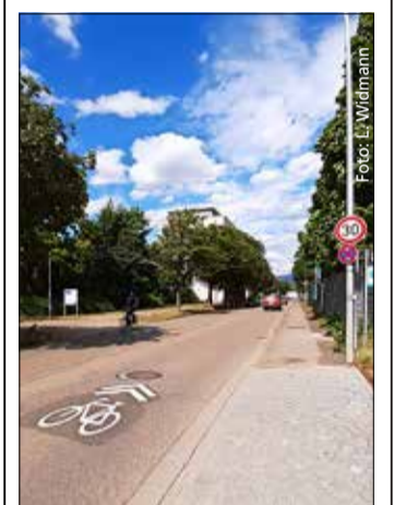
Obacht: In der Engesserstraße gilt jetzt Tempo 30. Auf Rücksicht für Radelnde weisen die neuen Piktogramme hin.