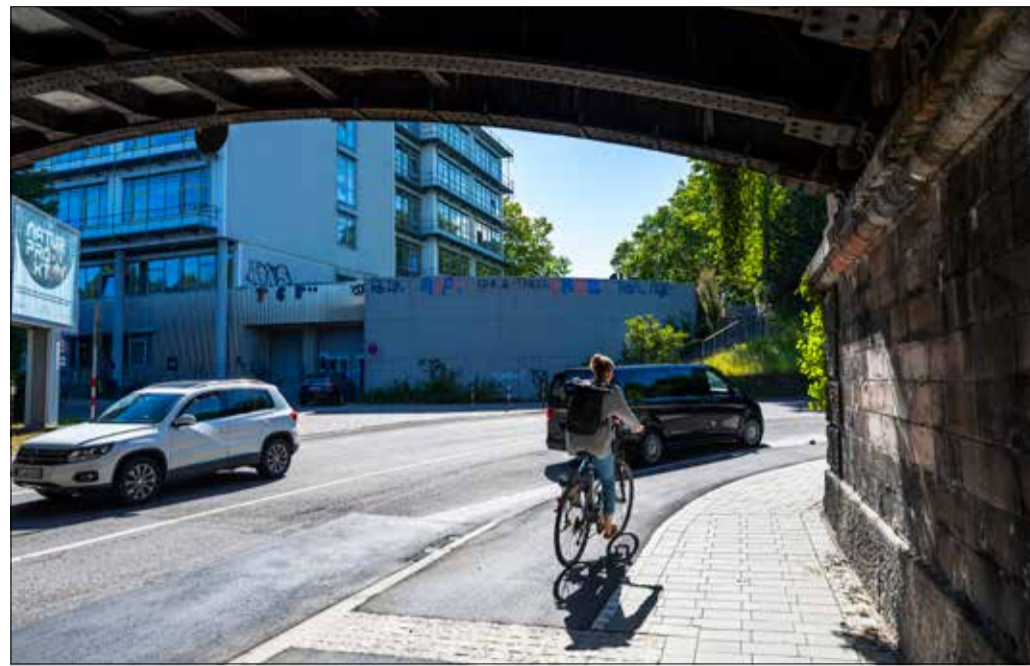
Besser ist das: Rund um die Bahnunterführung in der Breisacher Straße gibt es jetzt ordentliche Fuß- und Radwege. Das macht das Radeln sicherer und attraktiver.

Stadtauswärts Richtung Stühlinger dürfen bergab fahrende Lkw den Zweiradver-