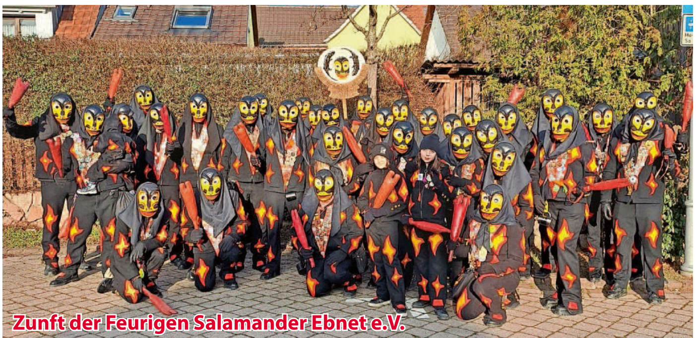
Zunft der Feurigen Salamander Ebnet e.V.