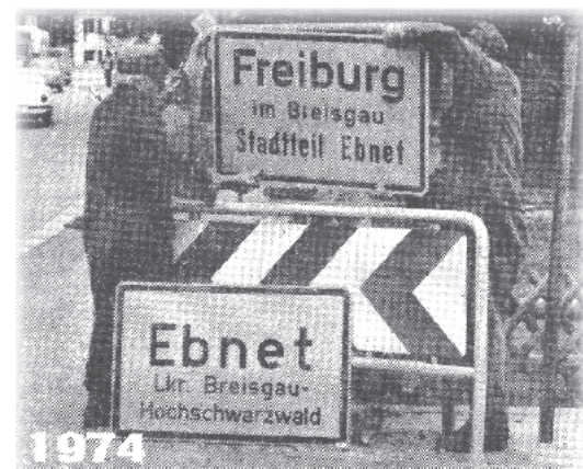
Die Stadtteile Ebnet und Kappel werden in die Stadt Freiburg eingemeindet