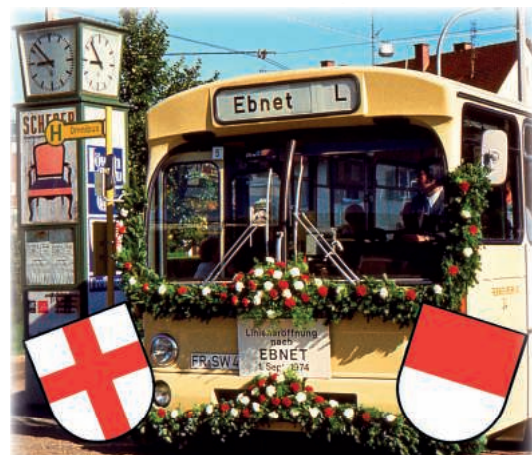
1.7.2014 - 40 Jahre Eingemeindung Ebnet

Aus den selbständigen Gemeinderäten wurden neue Ortschaftsräte