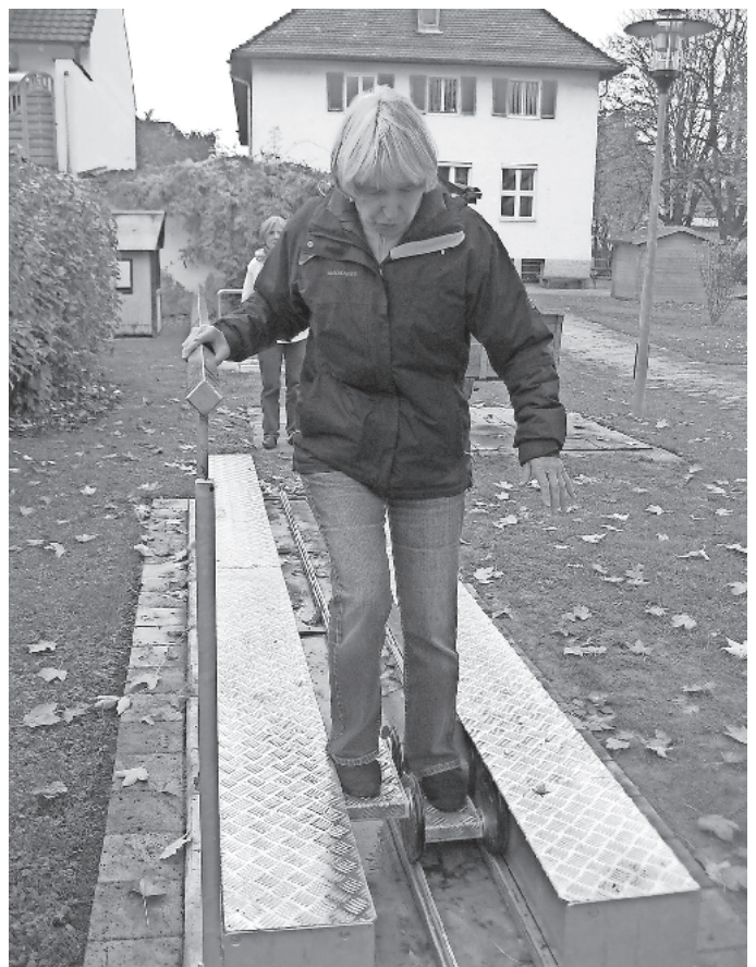
„... so wird trainiert!“