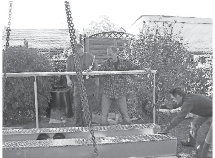
Pedalo wird eingesetzt