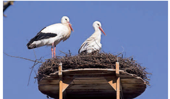
Im neuen Nest passt alles

Einen Tag „Urlaub“ nehmen musste am vergangenen Wochenende das Storchchenpaar auf der St. Martins-Kirche. Das alte Nest war über all die Jahre hinweg zu groß und zu schwer geworden. Es bestand die Gefahr von statischen Problemen im historischen Kirchendach. Nachdem ein Kranwagen mit großem Ausleger das Nest nicht erreichen konnte, wurde eine Baumklettererfirma um Unterstützung gebeten. Innerhalb von sechs Stunden wurde das Nest von den drei Mitarbeitern der Firma zurückgebaut (Bild) und durch unser neu gebautes Nest ersetzt, gleichzeitig wurde auch die Dachrinnen gereinigt. 25 Müllsäcke wurden über die Wendeltreppen des Kirchturms ins Freie befördert und mit vier Frontladungen eines Traktors abgefahren.