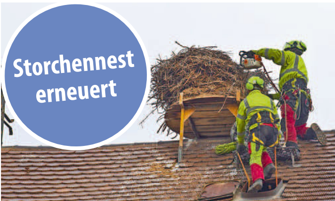
Baumkletterer bauen das alte Nest ab